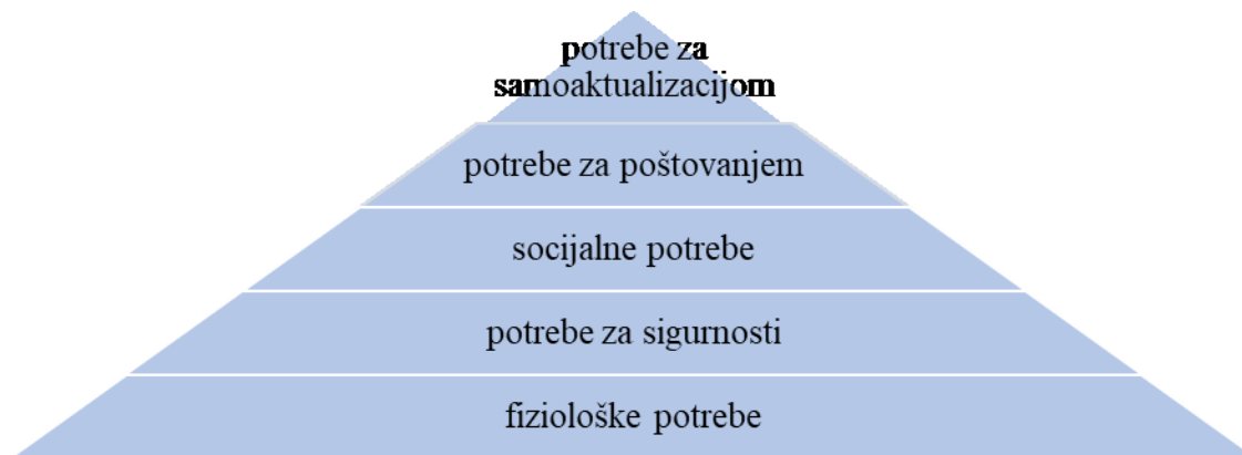
Slika 1. Maslowljeva hijerarhija potreba

Navedene Maslowljeve potrebe prikazane su na slici 1.