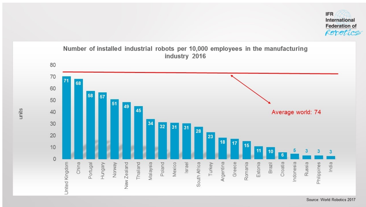
Grafikon 4. Broj robota na 10.000 zaposlenika u prerađivačkoj industriji 2016. godine