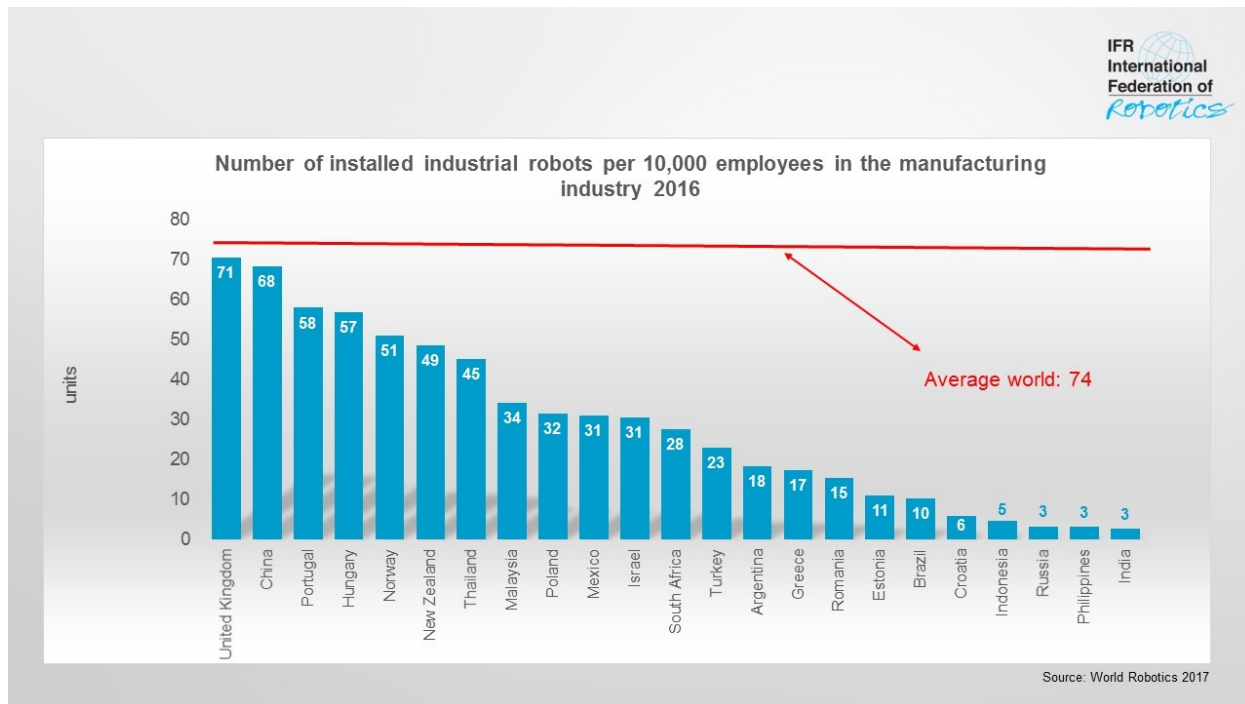
Grafikon 4. Broj robota na 10.000 zaposlenika u prerađivačkoj industriji 2016. godine