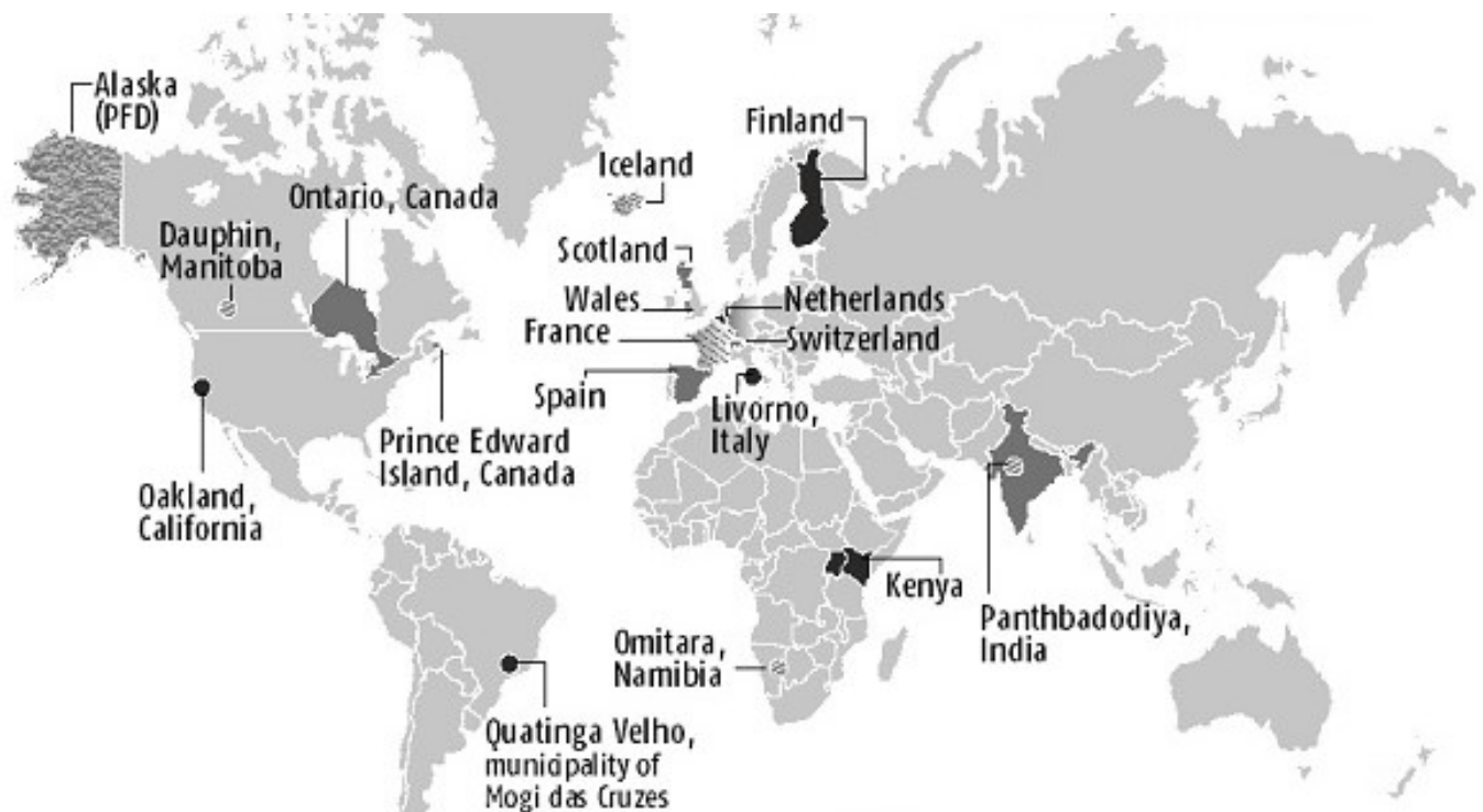
Slika 1. Prikaz provedenih eksperimentalnih programa implementacije univerzalnog temeljnog dohotka u svijetu