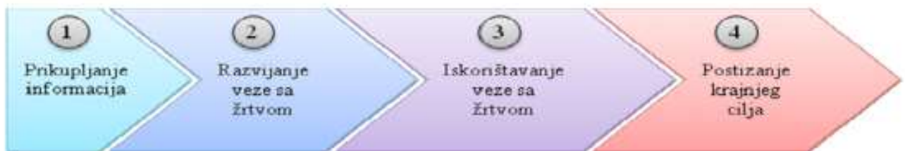
Slika 1. Etape socijalnog inženjeringa