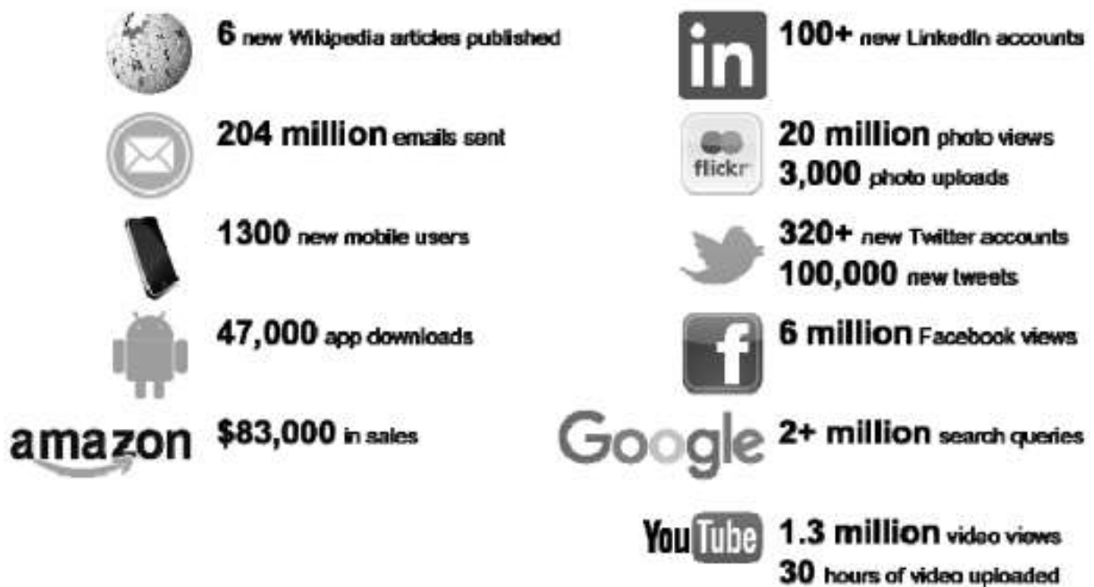
Slika 3. Nastanak virtualnih podataka u jednoj minuti

Izvor: Šebalj, D., Živković, A. i Hodak, K., Big data: changes in data management, 488.