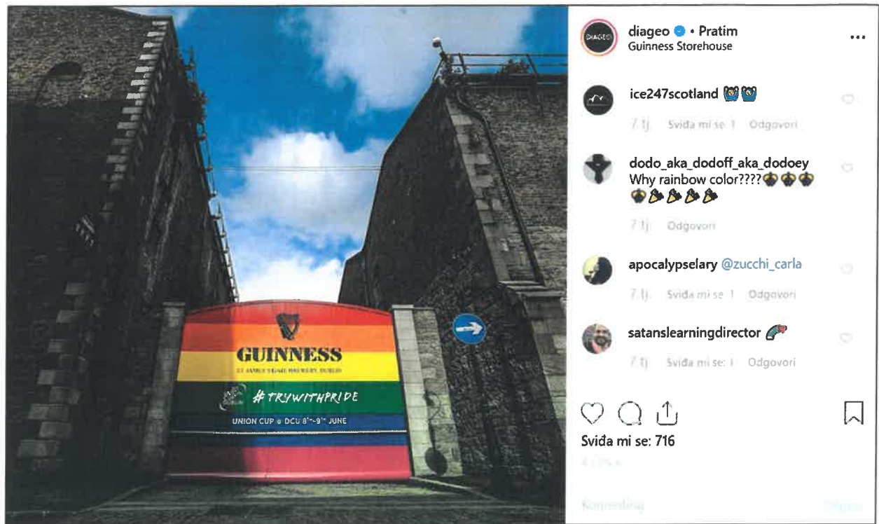
Slika 6.: Vrata Guinness postrojenja