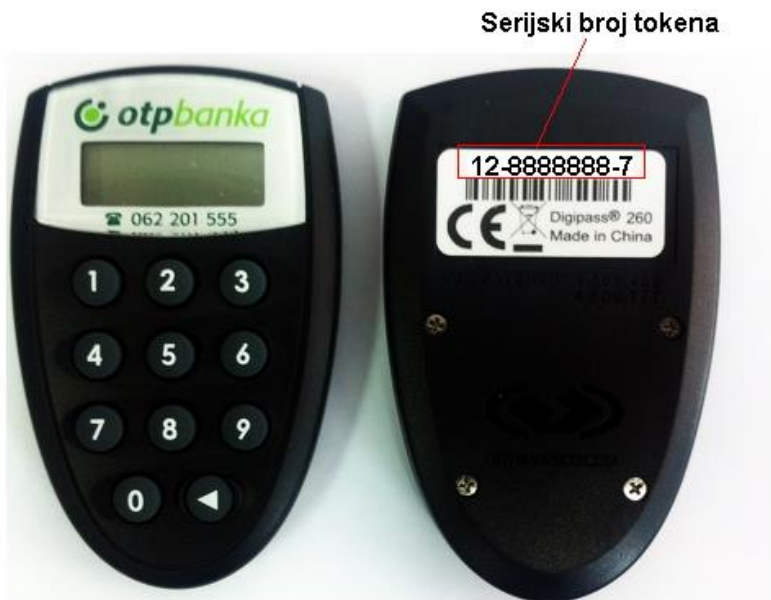
Slika 3. Token OTP Banke

„Ovakav način autorizacije koji se sastoji od dva faktora (serijskog broja tokena i niza jednokratnih brojeva koje token generira) omogućava računalu u banci da automatski identificira klijenta te mu omogući pristup svim njegovim računima.“ 58