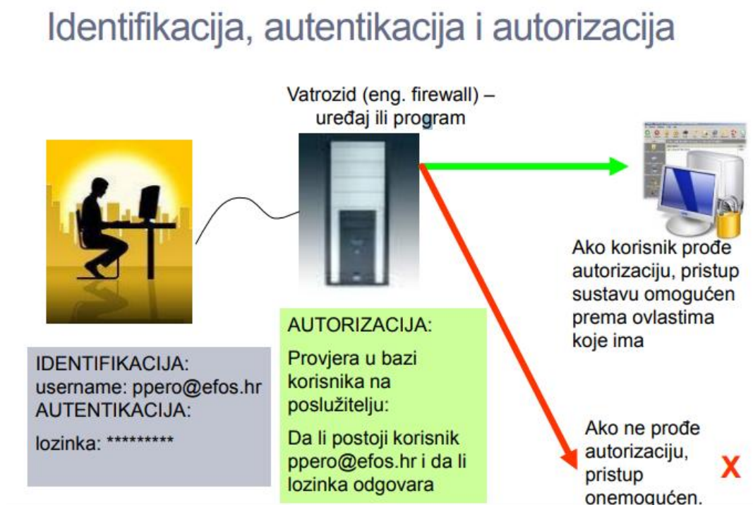
Slika 2. Proces identifikacije, autentikacije i autorizacije

U nastavku će biti prikazani proces identifikacije, autentikacije i autorizacije.