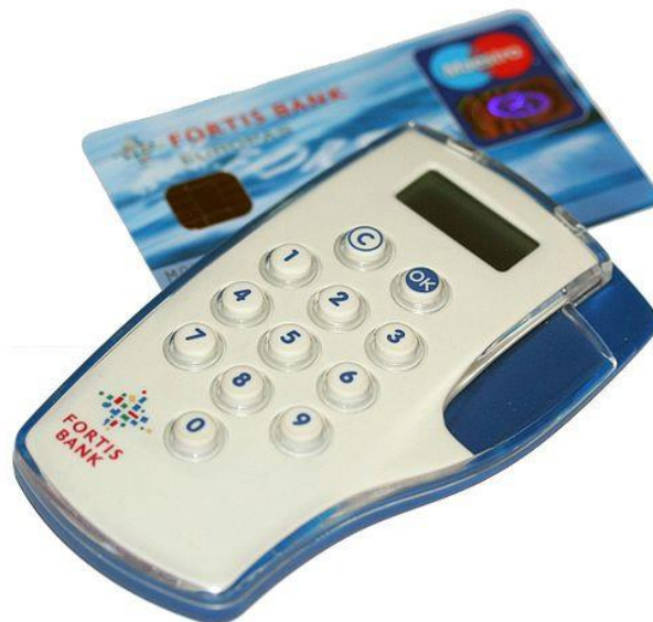
Slika 5. Token i smart kartica

Kartica se temelji na PKI (Public Key Infrastructure) tehnologiji koja se zasniva na asimetričnoj kriptografiji, odnosno na paru tajnih i javnih ključeva za šifriranje podataka. Svaki korisnik ima svoj javni ključ i svoj tajni ključ. Samo je javni ključ korisnika dan drugima na uvid. Korisnik podatke koje želi nekome poslati šifrira svojim tajnim ključem. Kada bi takvi podatke poslali, pročitati bi ih mogao svatko tko posjeduje javni ključ pošiljatelja. „Iz tog razloga pošiljatelj šifrira podatke još jedanput, ovaj put javnim ključem primatelja podataka. Na taj su način podaci dostupni samo primatelju. Naime, primatelj ih mora dešifrirati najprije pošiljateljevim javnim ključem, a zatim i svojim tajnim ključem. Svi su ti ključevi u digitalnom obliku pohranjeni na smart-kartici.“ 61