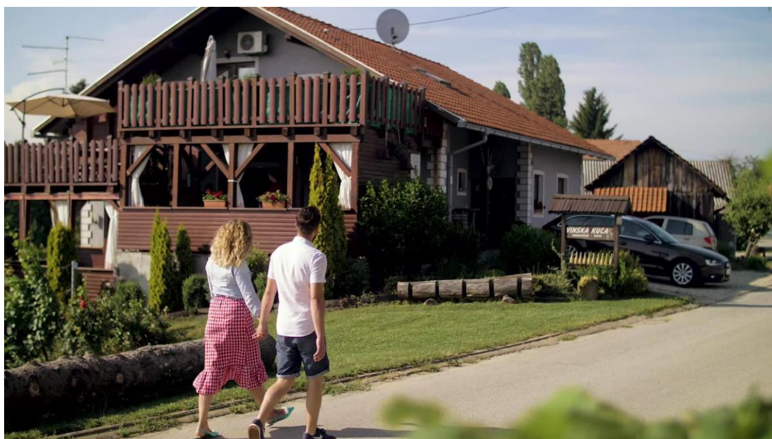
slika 5.1. Vinska kuća Dvanajščak – Kozol

od vodećih svjetskih kušača i predsjednik ocjenivačke komisije na Decanterovom panelu, je graševinu vinarije Dvanajščak iz 2006. ocijenio sa 93 boda od 100 što vino postavlja u ravnopravni položaj s najboljim vinima u svijetu. Obitelj Dvanajščak Kozol ima tri butelje na koje posvećuju više pažnje. Takvih je buteljirano samo po 1000 boca za sorte Sauvignon, Pušipel i Pinot crni. U vrlo lijepo uređenoj i klimatiziranoj kušaonici vina, uz kvalitetna vina nude se i domaći proizvodi te topli i hladni napici. Uz najavu postoji mogućnost organizacije poslovnih i obiteljskih domjenaka te stručno vođenih degustacija.