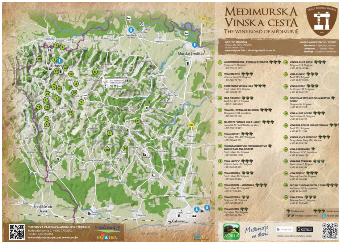
slika 5.2. Međimurska vinska cesta