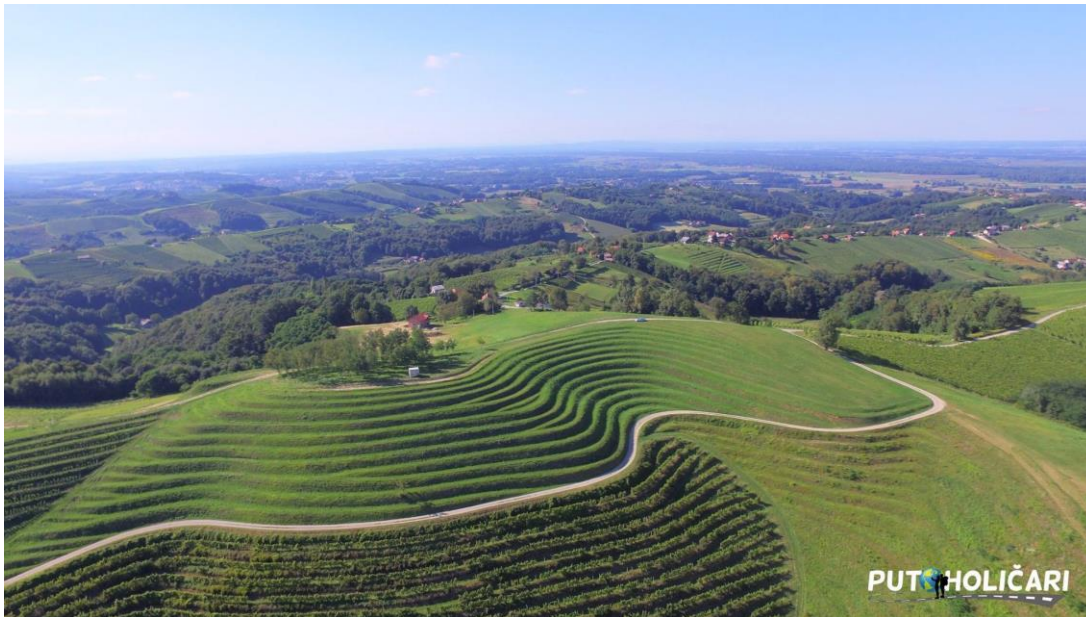
Slika 4.2. Mađerkin breg