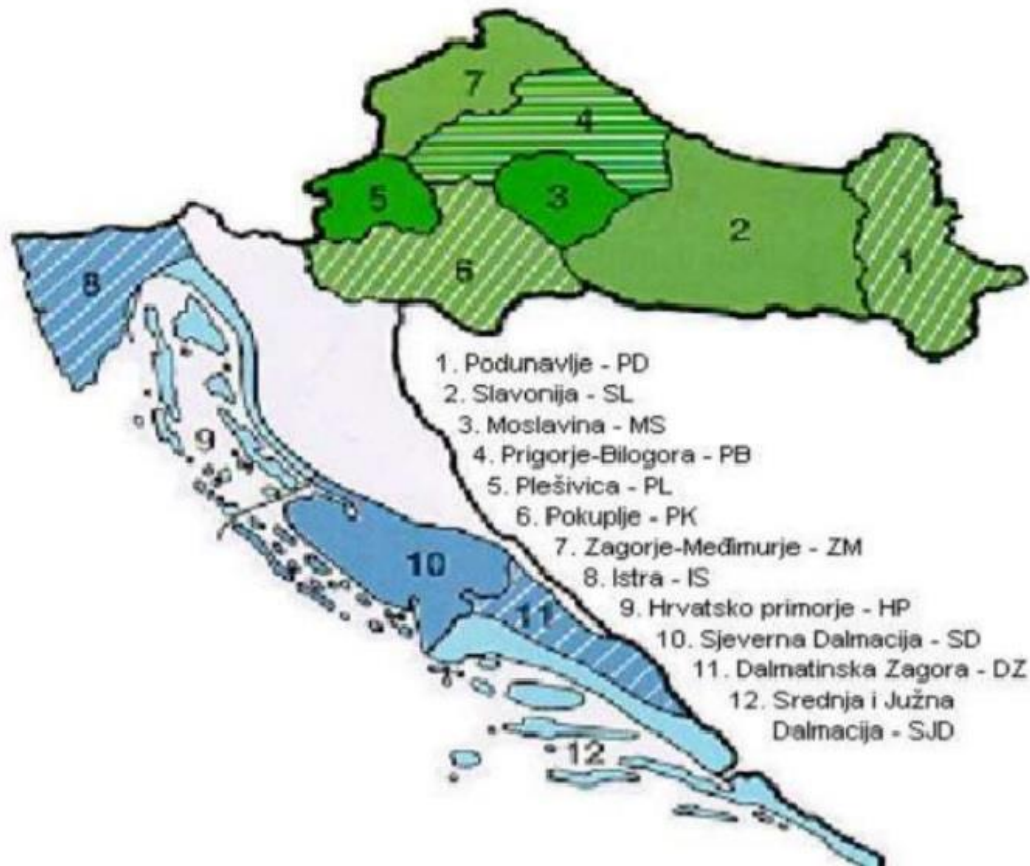
Slika 3.1. Podjela regije u 12 podregija