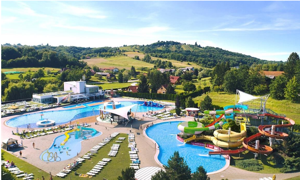
slika 4.3. Vanjski bazeni Life class terme Sveti Martin