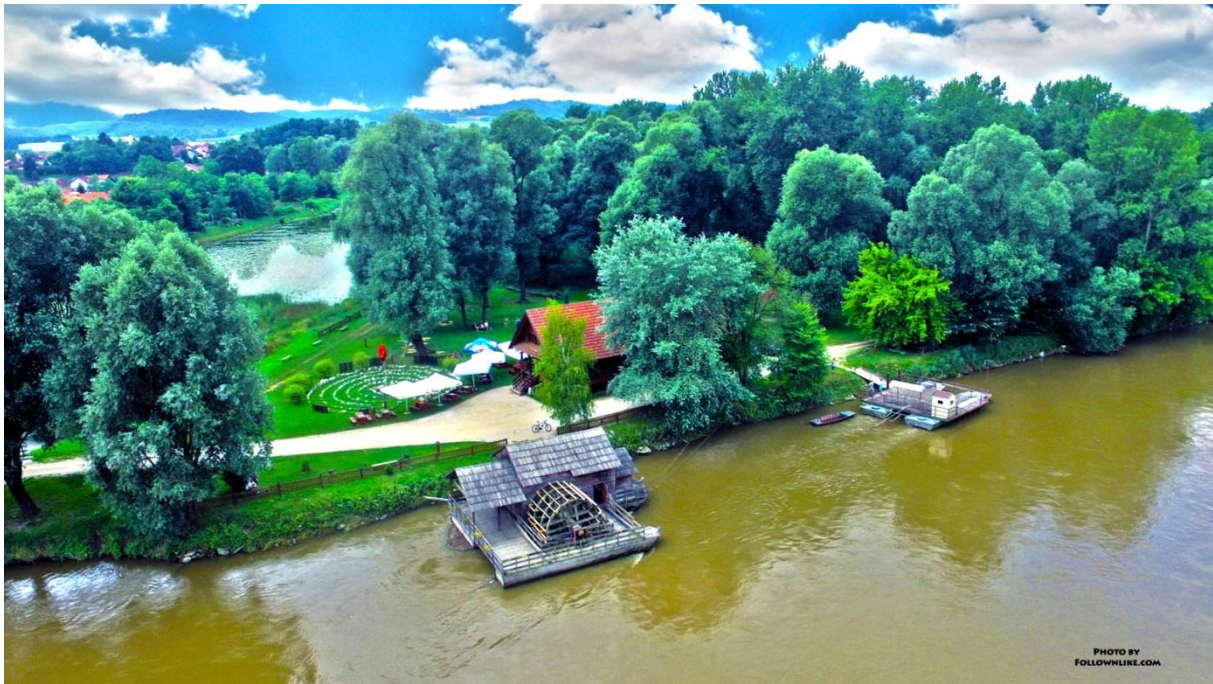
Slika 4.5. Mlin na Muri