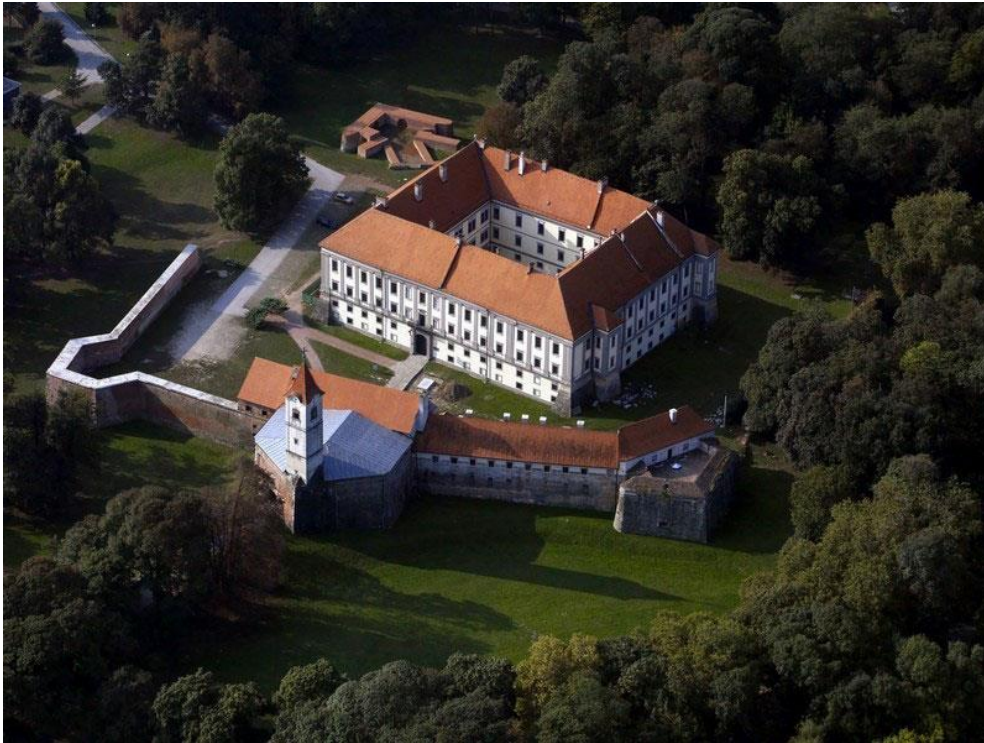
Slika 4.4. Stari grad Čakovec i perivoj Zrinski