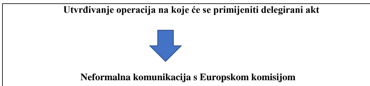
Slika 1. Proces donošenja delegiranog akta:

Kako bi dodatno potaknula zemlje članice na definiranje jediničnih troškova u projektima financiranim iz Europskog socijalnog fonda koji se zatim uključuju u delegirani akt, Europska je komisija objavila dodatne Smjernice 70 u kojima objašnjava prednosti donošenja delegiranog akta i potiče zemlje članice na dostavu prijedloga jediničnih troškova ili fiksnih iznosa. Preporučuje se delegiranim aktom definirati troškove u standardiziranim operacijama koje se provode kroz nekoliko godina i za koje su namijenjena značajna sredstva Europskog socijalnog fonda. Jedan od preduvjeta je i mogućnost jasnog definiranja pokazatelja rezultata i načina mjerenja postignuća. Ističu se prednosti donošenja delegiranog akta i u slučajevima kada nacionalno zakonodavstvo ne predviđa uporabu jediničnih troškova i fiksnih iznosa u međusobnom odnosu Upravljačkog tijela i korisnika. Tada je procedura verificiranja troškova korisnika utemeljena na stvarnim troškovima i detaljnim postupcima provjere i računovodstvenog evidentiranja pojedinačnih troškova, ali je procedura deklariranja troškova prema Europskoj komisiji pojednostavljena i definirana delegiranim aktom.