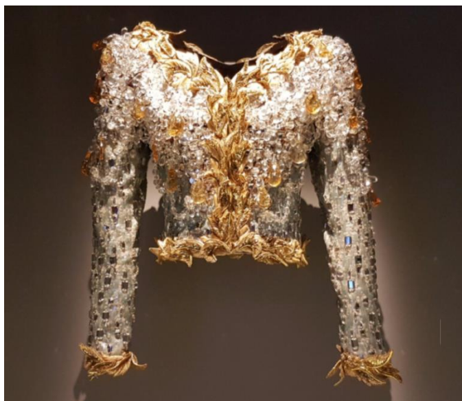
Slika 16 YSL, večernja jakna iz kolekcije visoke mode