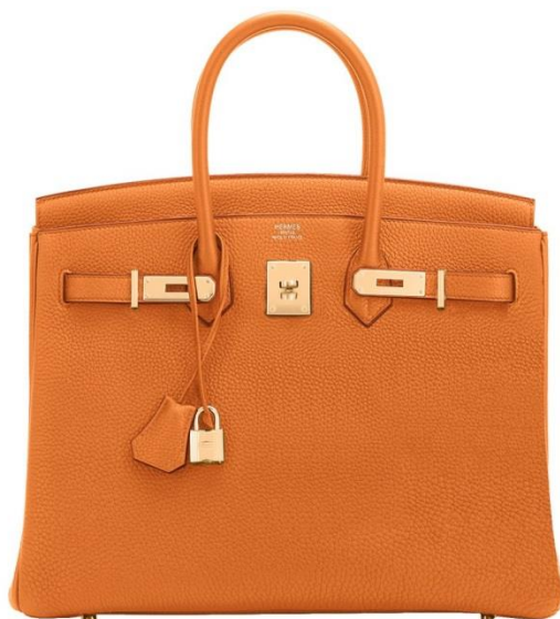
Slika 3 Hermès Birkin torba