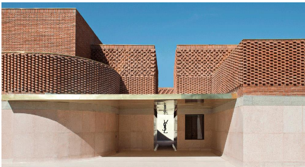
Slika 9 YSL Muzej u Maroku