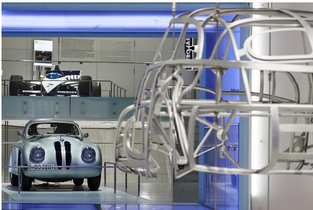
Slika 8 BMW Muzej, unutrašnjost