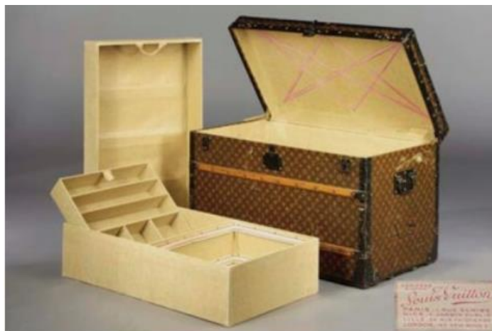
Slika 2 Louis Vuitton kovčeg (između 1896-1900. g.)

Izvor: Christies, https://www.christies.com/lotfinder/Lot/louis-vuitton-a-hardside-suitcase-4944267-details.aspx ,