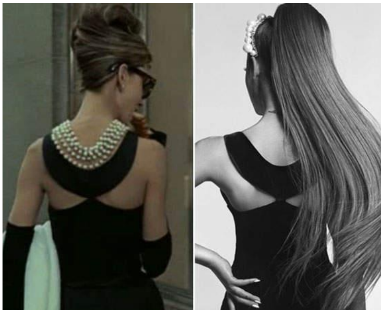
Slika 4 Givenchy marketinška kampanja, jesen/zima 2019