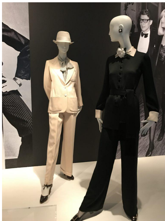
Slika 15 YSL Jumpsuit and Suit