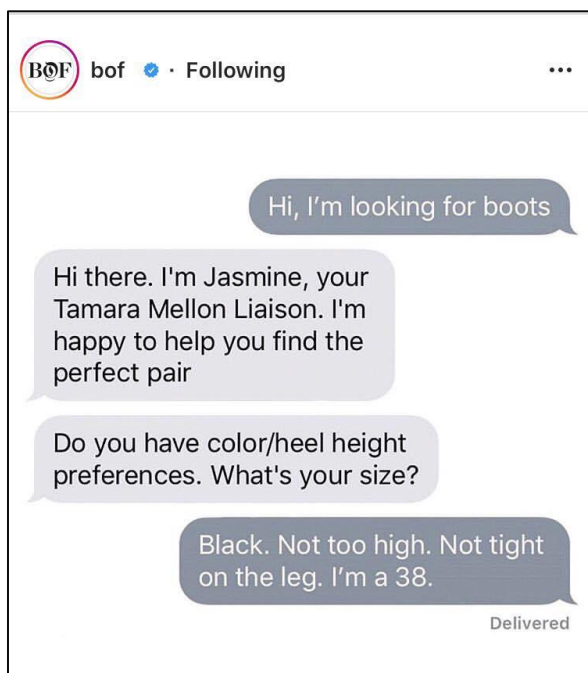
Slika 5 Chatbot Tamara Mellon