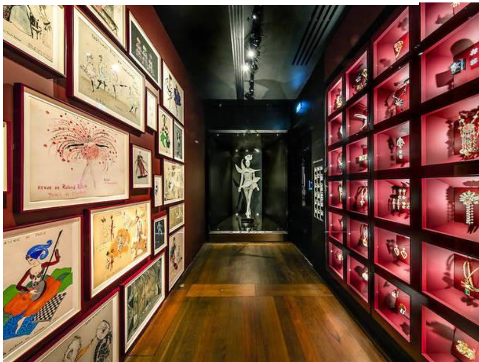
Slika 7. YSL korporativni muzej u Parizu