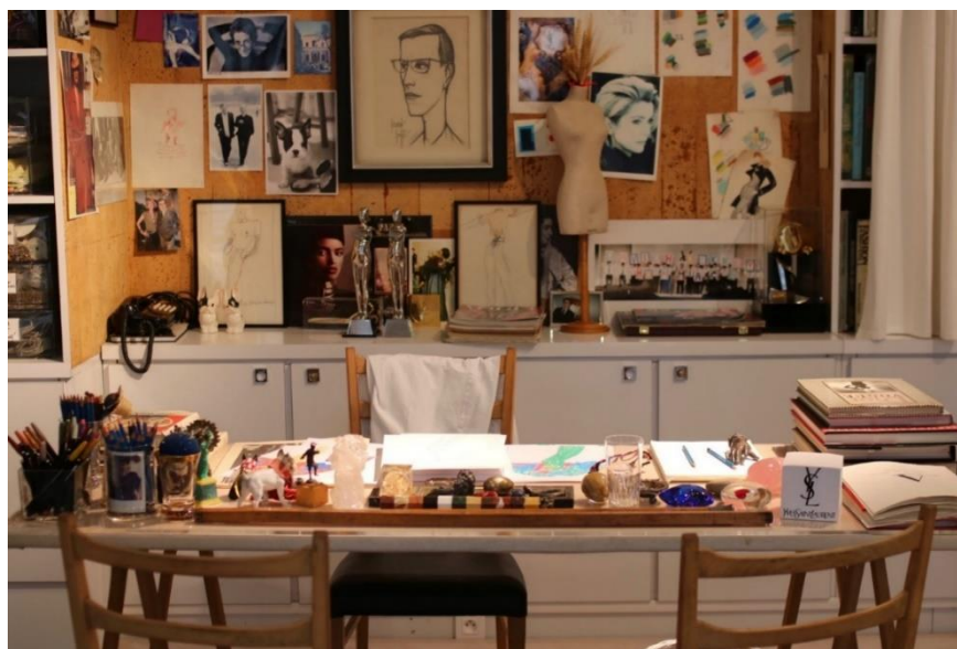
Slika 18 YSL stol