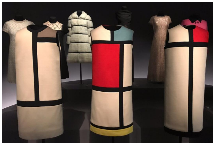
Slika 14 YSL Mondrian haljine