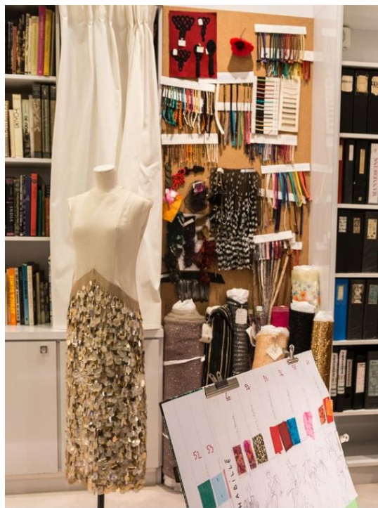
Slika 17 YSL studio