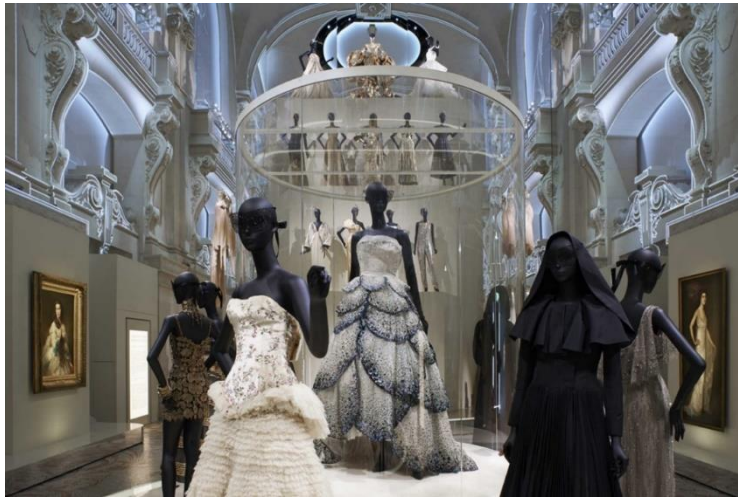
Slika 11 Musée des arts décoratifs de Paris