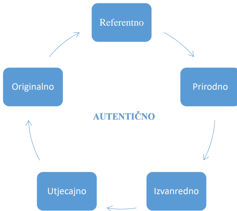
Slika 1. Dimenzije autentičnosti prema Gilmore i Pine (2007.)