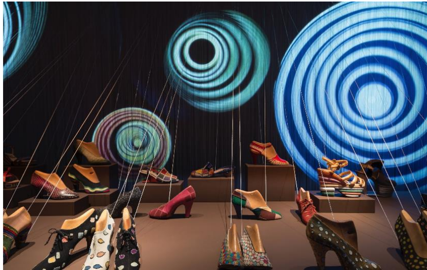
Slika 12. Ferragamo korporativni muzej u Firenci