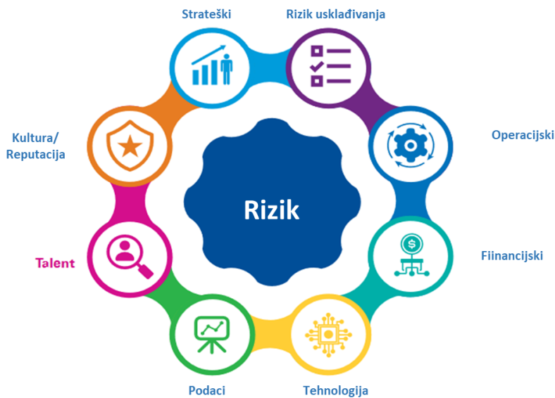
Slika 1. Čimbenici koji utječu na rizike u maloprodaji