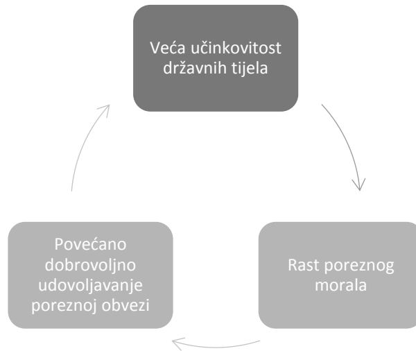
Grafikon 5. Fiskalna razmjena

poreza (kao i učinkovite provedbe zakon); ili dokaz fiskalnog ugovora između poreznih obveznika i države. 80