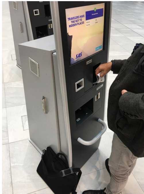
Slika 3. Samoposlužni kiosk u zračnoj luci