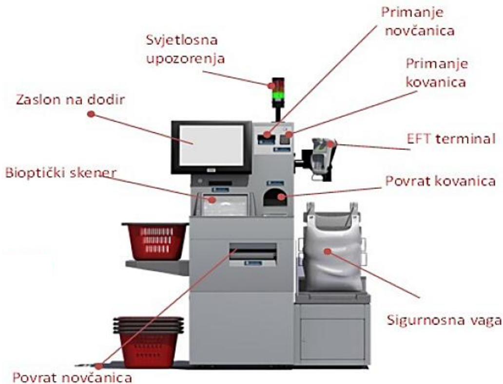
Slika 4. Komponente samoposlužne blagajne