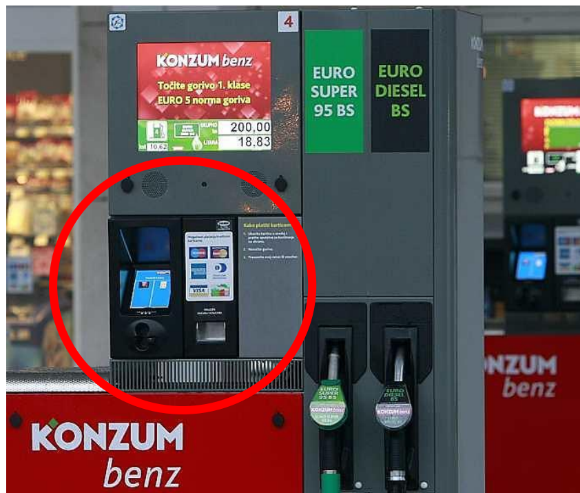
Slika 2. Samoposlužna benzinska postaja