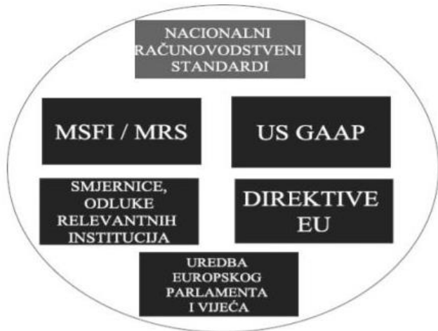
Slika 1 Instrumenti harmonizacije računovodstva