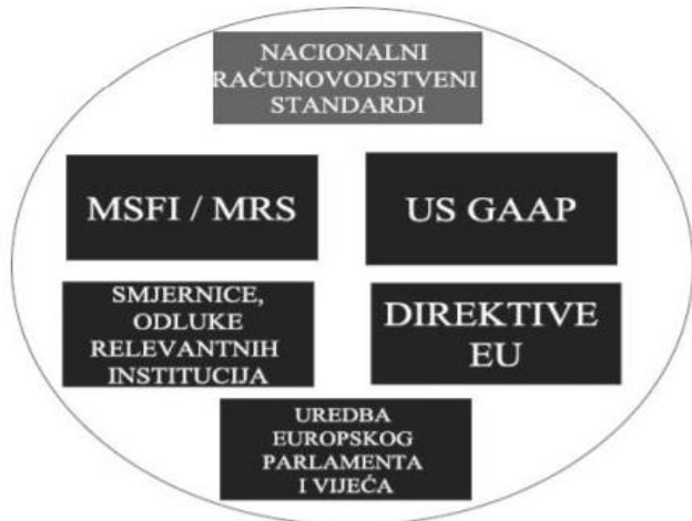
Slika 1 Instrumenti harmonizacije računovodstva

Izvor: Žager, K. et al. (2008): Analiza financijskih izvještaja , 2. prošireno izdanje, Zagreb: Masmedia d.o.o., str. 161.