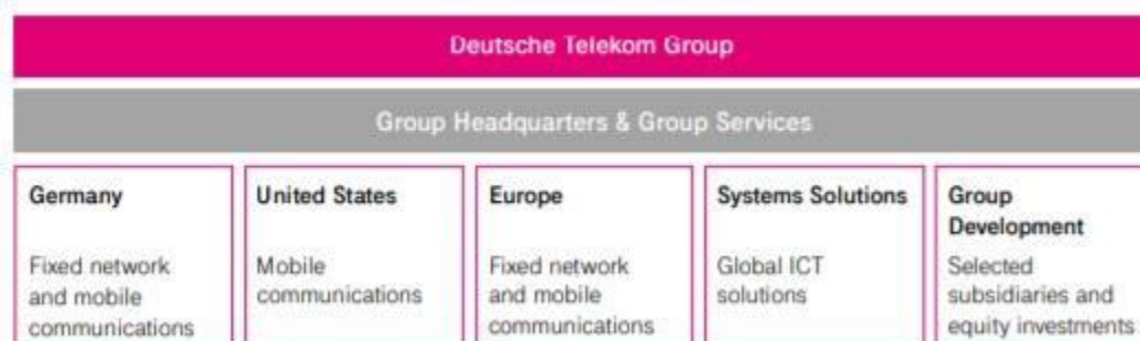
Slika 4 Operativni segmenti Deutsche Telekom-a