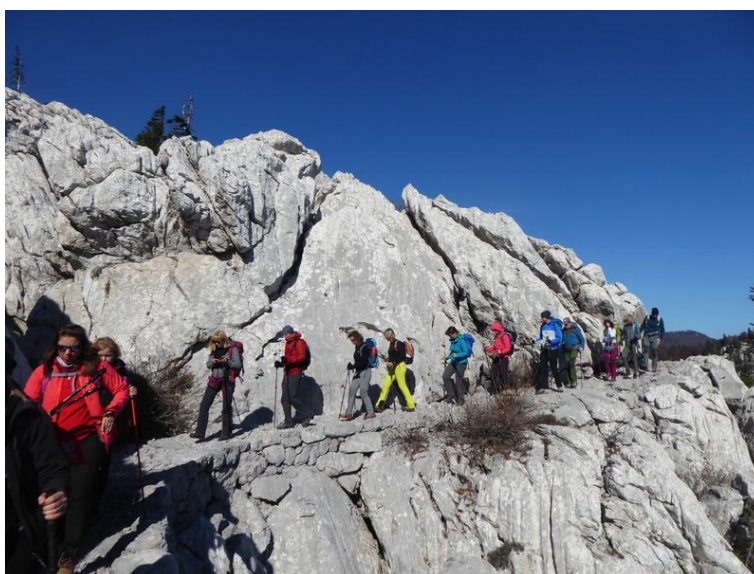
Slika 3. Premužićeva staza