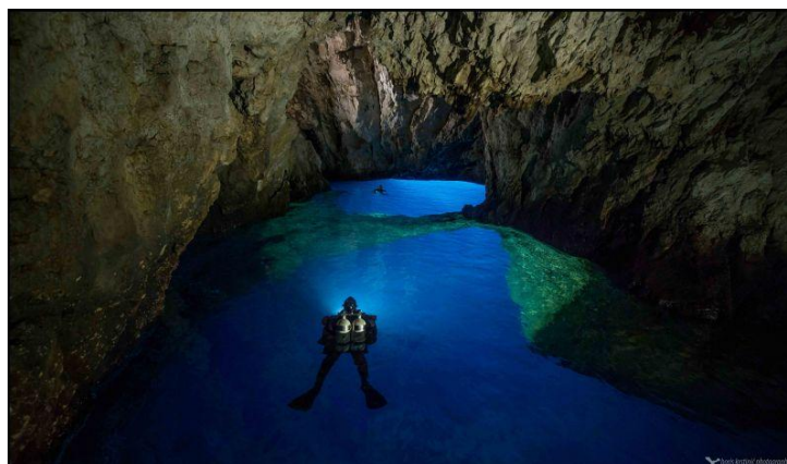
Slika 8. Modra špilja