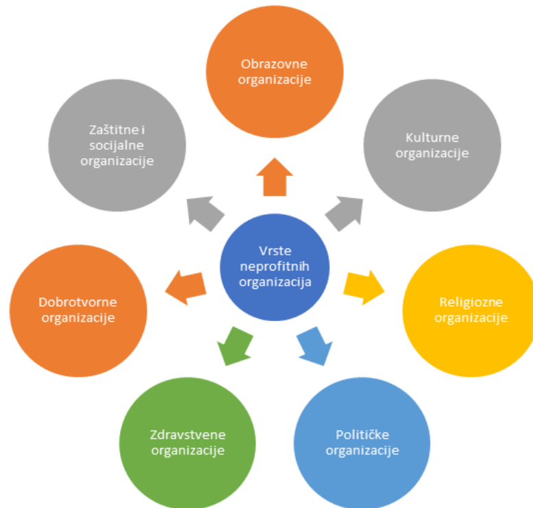
Slika 1. Ključna podjela neprofitnih organizacija