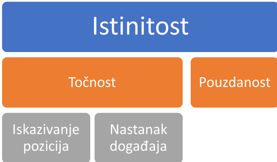
Slika 2. Temeljna načela računovodstva neprofitnih organizacija