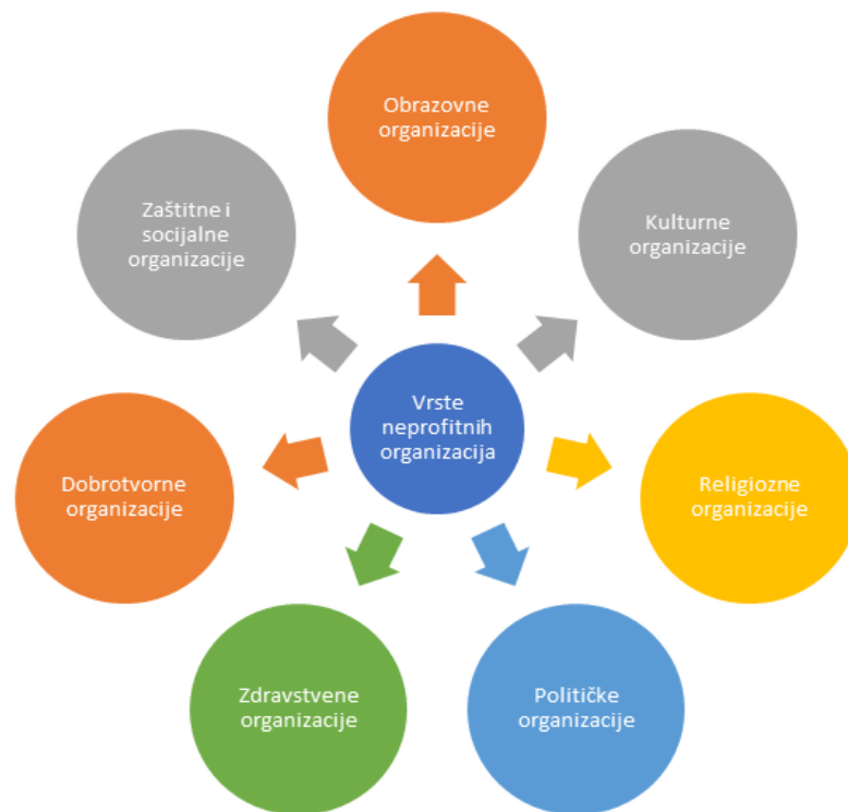
Slika 1. Ključna podjela neprofitnih organizacija