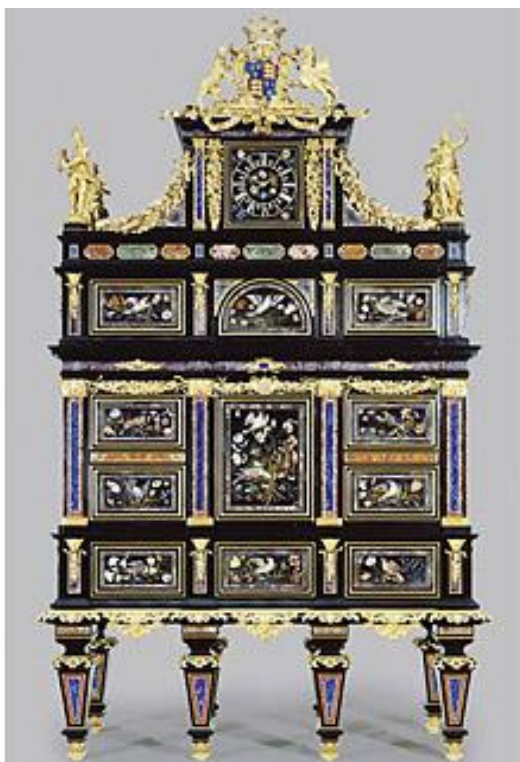
Slika 9: Badminton Cabinet