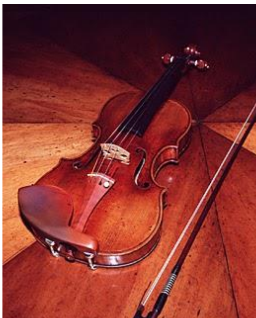
Slika 5: Violina Guaeneri-a del Gesu-a