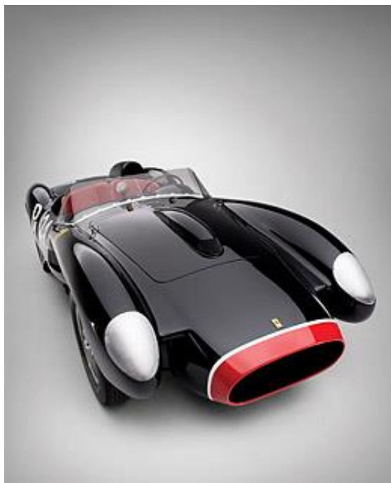
Slika 8: Ferrari 250 Testa Rossa

aukcija, koju su u svibnju 2009. organizirali RM Auctions i Sotheby's, dokazala je da je najmanje jedan luksuzni predmet preživio recesiju jer je prodan za 12,2 miliona dolara. 18