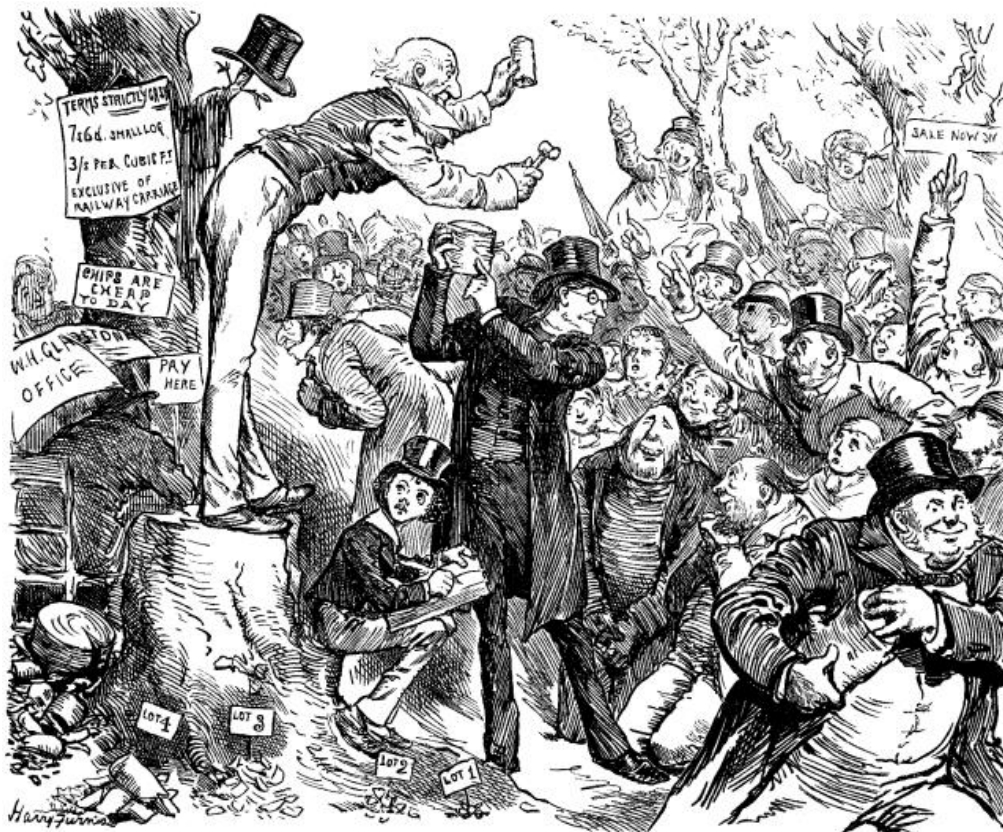
Slika 1: Ilustracija aukcije u prošlosti

Riječ “aukcija” dolazi od latinske riječi “auctus”, što znači “povećati se”. Rim je bio prvi narod koji je licencirao aukcionare. Rimski car Marko Aurelije na aukciji je prodao sav svoj obiteljski namještaj kako bi podmirio dugove koje je imao. “Magister Auctionarium” ubacio je koplje u zemlju kako bi označio početak aukcije, a danas aukcionari često koriste čekić na aukciji. Godine 1674. u Švedskoj, točnije Stockholmu osnovana je najstarija aukcijska kuća sa strane Claesa Ralamba, tadašnjeg švedskog državnika, koja dan danas posluje. U početku Claesove usluge koristili su klijenti poput švedskog kralja Charlesa XI, koji je prodao lovačku pušku za 900 srebrnih novčića, te švedskog kralja Gustava III. koji je kupio Rembrandt-ovu knjigu pod nazivom “Kuhinja”, te svjetski dramatičar August Strindberg, koji je kupio knjige. 1