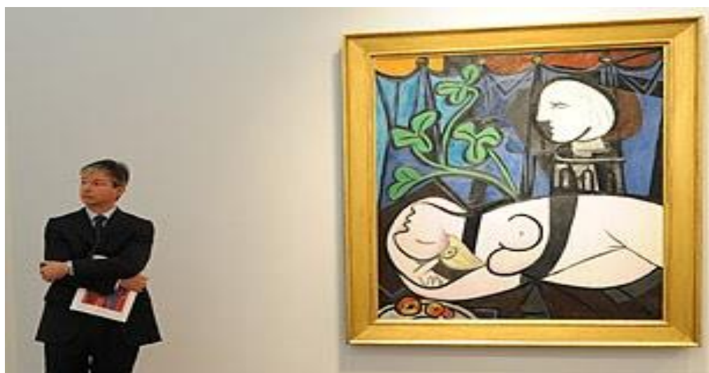
Slika 2: Slika "Golotinja, zeleno lišće i poprsje"

Slika Pabla Picassa prodana je 4. svibnja, 2010. godine za malo više od 8 minuta po rekordnoj cijeni od 106,5 milijuna dolara. Picassova slika "Golotinja, zeleno lišće i poprsje" stvorena je u jednom danu 1932. godine. Cijena Picassove slike pobija prethodni rekord od 104,3 milijuna dolara za Giacomettijevu skulpturu "Čovjek koji hoda". Također, ovo nije prvi put da se Picassova slika prodala po rekordnoj cijeni. Tako je 2004. godine, slika pod nazivom "Dječak s cijevi (Mladi šegrt)" tada prodana za nevjerojatnih 104,1 milijuna dolara. 12