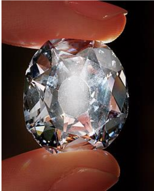
Slika 10: Wittelsbach dijamant