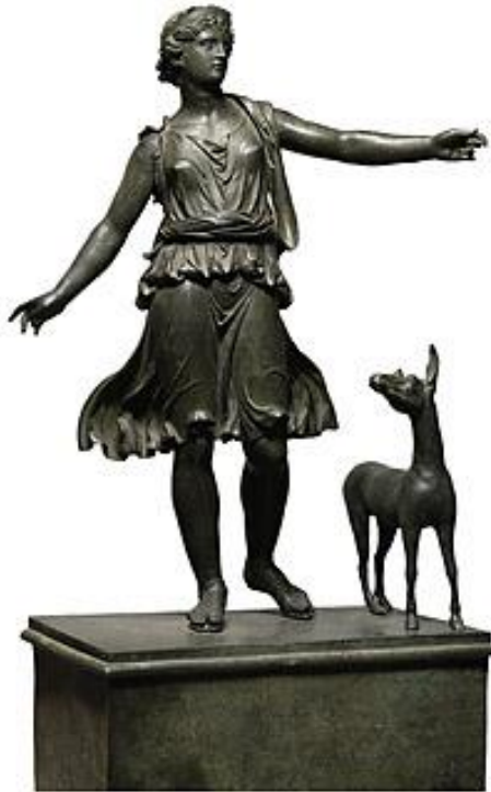
Slika 7: Kip Artemida i Sta

Kada su građevinski radnici 1920-ih prvi put pronašli brončanu skulpturu staru 2000 godina u Rimu, nikada nisu mogli pretpostaviti da će doći do najviše cijene bilo koje relikvije - ustvari za bilo koju skulpturu ikad prodanu na aukciji. Kip je prodan za 28,6 miliona dolara. 17