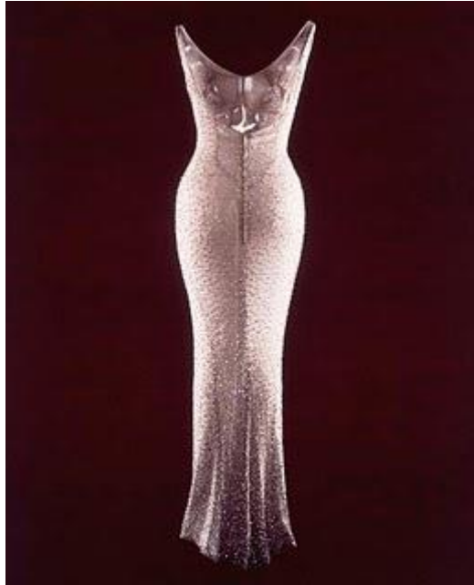
Slika 3: Haljina "Sretan rođendan"

predsjednika tvrtke Roberta Schargena zašto bi potrošio bogatstvo na komad tkanine koji izvorno košta 12000 dolara, izjavio je da bi platio i dvostruko više, također se hvalio kako ju je i ukrao. 13