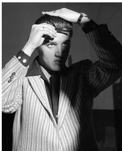
Slika 6: Elvis Presley

Pored svog lijepog glasa i ljuljajućih bokova, Elvis Presley bio je poznat i po svojoj bujnoj kosi. Stoga možda nije iznenađujuće da će pramen kralja “Rock’n’Roll-a” biti najtraženiji i najskuplji predmet prodaje aukcije koji se prodao za 115 000 dolara. 16