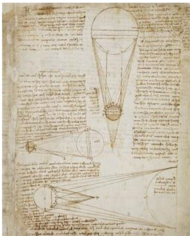
Slika 4: Korekcija rukopisa "Codex Hammer"