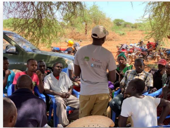
Slika 3. – Sastanak u sklopu projekta zaštite slonova 16

Nevezano uz zakladu, TUI ima isplaniranu održivu strategiju koja se temelji na 4 glavna stupa. Dijelovi strategije, odnosno 4 temeljna stupa nazivaju se “Korakni lagano”, “Napravi razliku”, “Vodi” te “Brini više”. 17 Unutar dijela “Korakni lagano” turistička grupacija TUI bavi se problemom utjecaja praznika na okoliš pa se tako TUI pridružio i globalnoj inicijativi zaduženj za rješavanje problema onečišćenja plastikom. Cilj je smanjiti onečišćenje i proizvodnju plastike. Da bi ostvarili tu viziju, kreću od sebe, a turističke tvrtke i destinacije s kojima surađuje obvezuju se ukloniti bespotrebne plastične predmete i reciklirati plastiku. TUI ima plan do kraja 2020. godine ukloniti 250 milijuna komada plastičnih predmeta za jednokratnu upotrebu u svim svojim hotelima, kruzerima, zrakoplovnim kompanijama i uredima. Plastično zagađenje u velikoj mjeri utječe negativno na putovanja i turizam, posebno u blizini plaža i oceana. Do 2050. predviđa se da bi u oceanima trebalo biti više plastičnog otpada nego ribe. To je jedan od najvećih ekoloških izazova suvremenog doba, a turizam bi trebao imati važnu ulogu u doprinošenju traženja rješenja. Prelaskom na cirkulirajući način s recikliranjem plastike, turistički sektor može dati pozitivne doprinose poput smanjenja odlagališta otpada, onečišćenja, iscrpljivanja prirodnih resursa, podizanja svijesti o zaštiti okoliša među gostima i osobljem. Inicijativa je vođena unutar zajednice