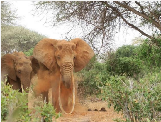
Slika 2. – Slonovi u području Tsavo 15