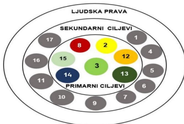
Slika 3. Primarni ciljevi poduzeća Philip Morris International