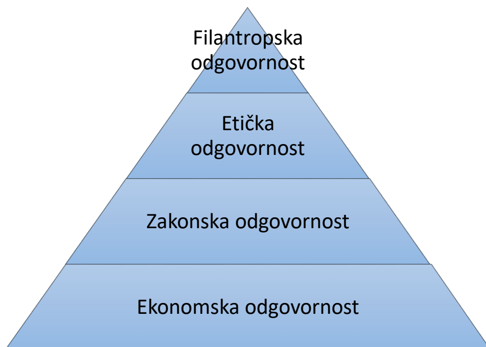
Slika 1. Prikaz komponenti društvene odgovornosti