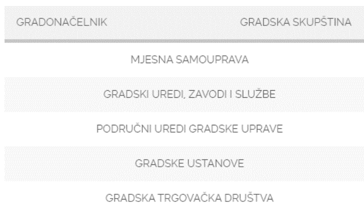
Slika 1: Ustrojstvo grada Zagreba

Zagreb je teritorijalno podijeljen na gradske četvrti (17) i naselja (70) dok je administrativno podijeljen na 17 gradskih četvrti (prva razina mjesne samouprave), u čijem su sastavu 218 Mjesnih odbora (druga razina mjesne samouprave). 5