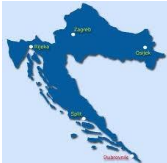
Slika 1. Prikaz državne granice Republike Hrvatske