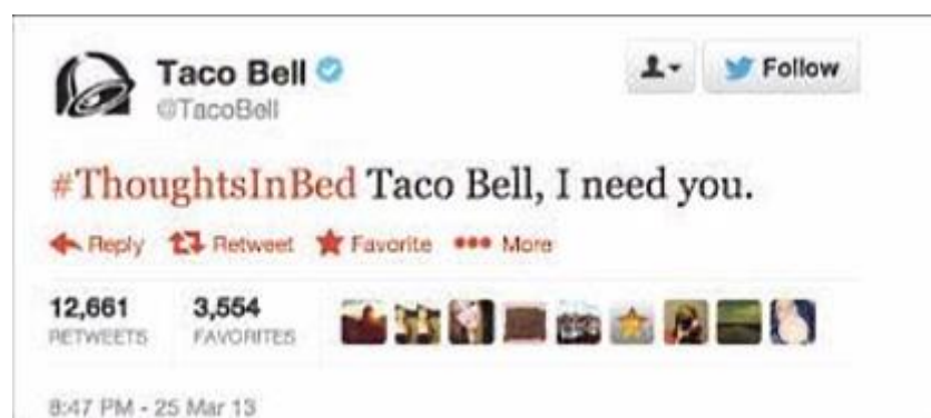
Slika 5 Primjer humoristične i kvalitetne poruke na Twitteru