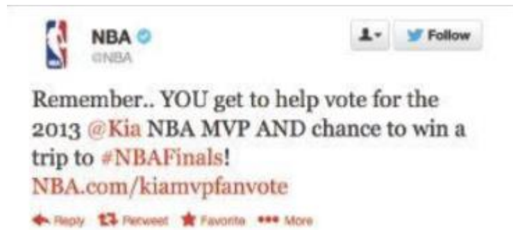
Slika 4 Primjer dobre komunikacije na Twitteru

Izvor: Vaynerchuk, G., (2013.) Jab, Jab, Jab, Right Hook . New York: Harper Business.