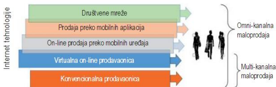
Slika 1 Multikanalna i omnikanalna maloprodaja