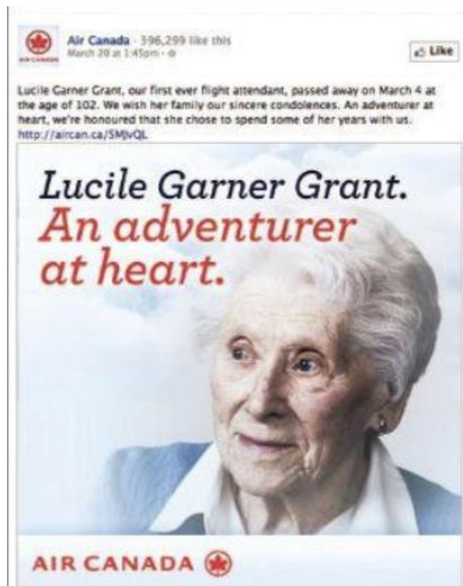
Slika 3 Primjer dobro pripremljene objave za Facebook

Izvor: Vaynerchuk, G., (2013.) Jab, Jab, Jab, Right Hook . New York: Harper Business.