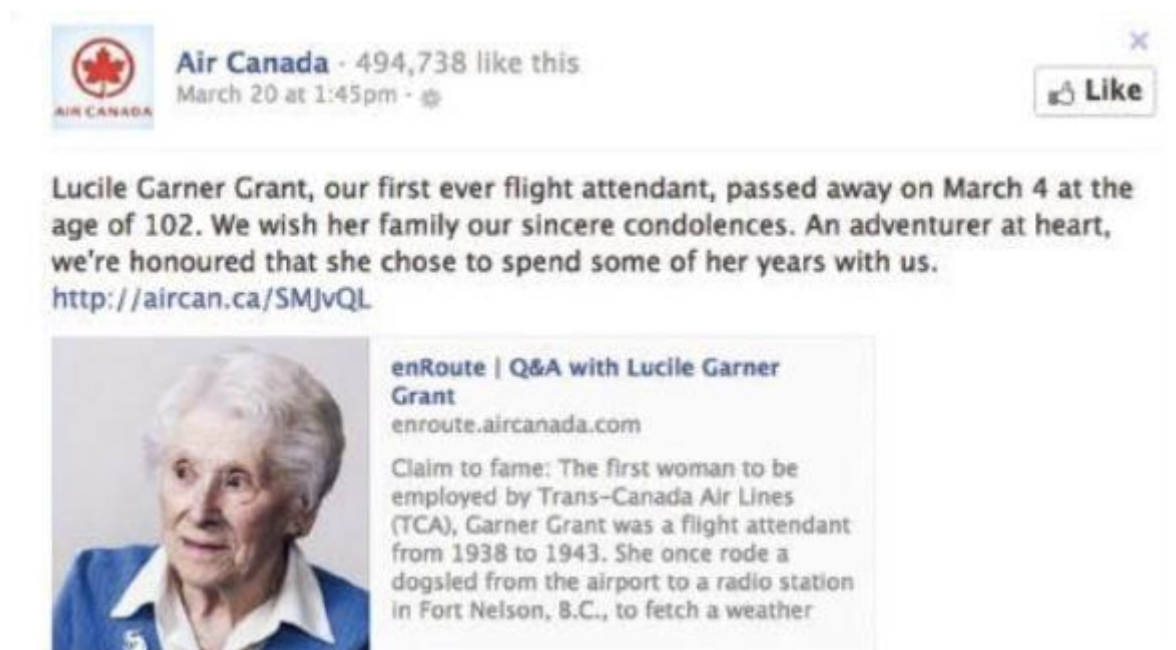
Slika 2 Primjer loše pripremljene objave za Facebook