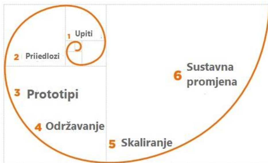
Slika 1. Proces društvenih inovacija