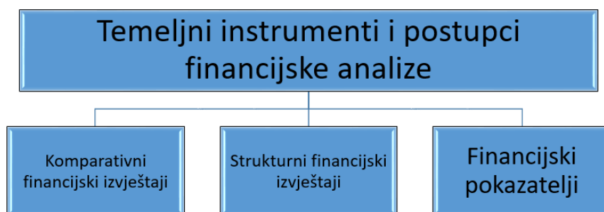
Slika 2. Temeljni instrumenti i postupci financijske analize

Izvor: Izrada autora uz pomoć (Žager, Mamić Sačer, Sever Mališ, Ježovita, Žager, 2020.)