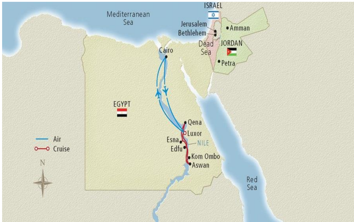
Slika 1. - Karta rute riječnog krstarenja po rijeci Nil