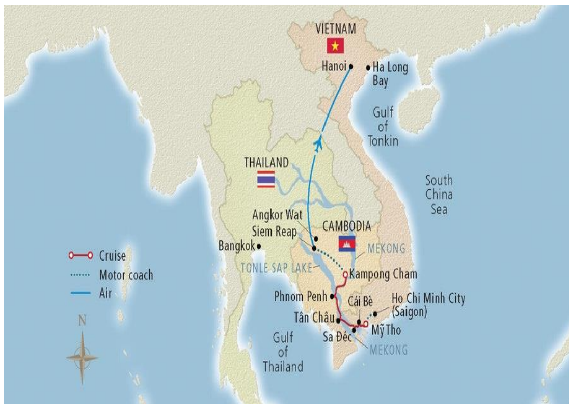
Slika 2-Karta rute riječnog krstarenja Mekongom

Na slici dva prikazana je ruta krstarenja po rijeci Mekong. Kao što se vidi na ovoj karti krstarenja rijekom Mekong, većina se krstarenja u regiji uglavnom fokusira na donji Mekong kojim se lakše navigira. Putuje se između Siem Reapa u Kambodži i Ho Chi Minh Citya u Vijetnamu. Države kroz koje se krstari su Vijetnam i Kambodža. Glavne luke u kojima se pristaje su Ho Chi Minh City, Siem Reap, Phnom Penh.