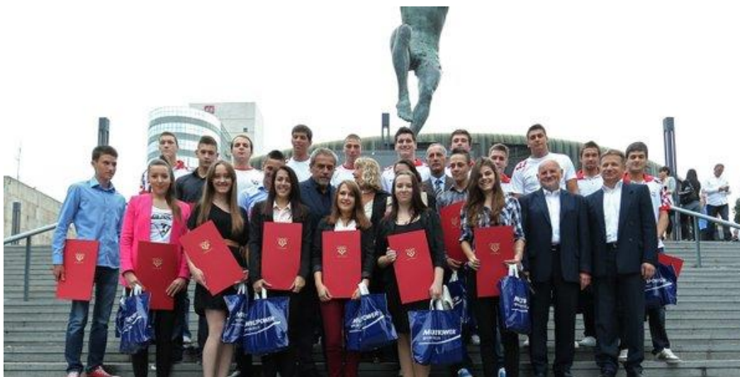
Slika 11. Prikaz podjele nagrade Dražen Petrović