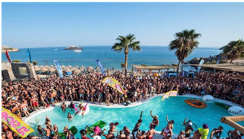
Slika 2. Party na Mykonosu u Grčkoj