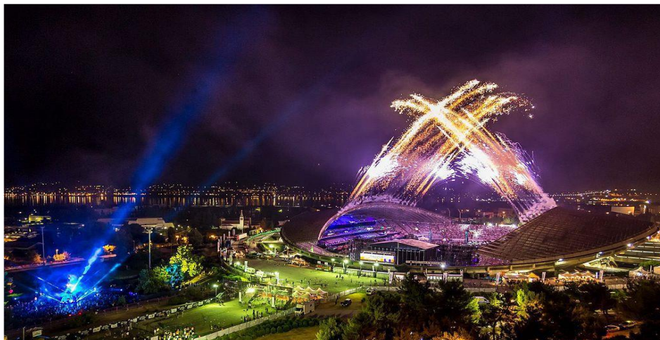
Slika 6. Ultra Europe festival u Splitu