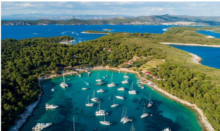
Slika 9. Pakleni otoci