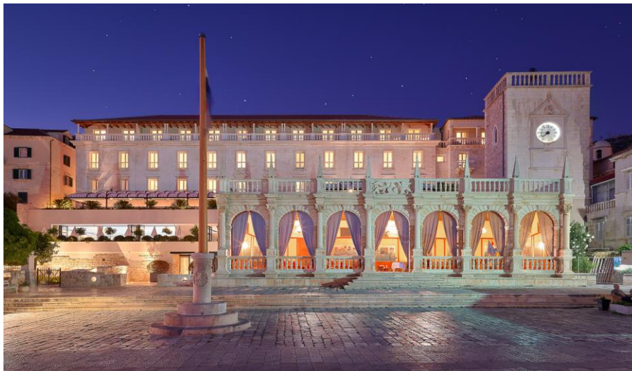
Slika 8. Hotel Palace u gradu Hvaru