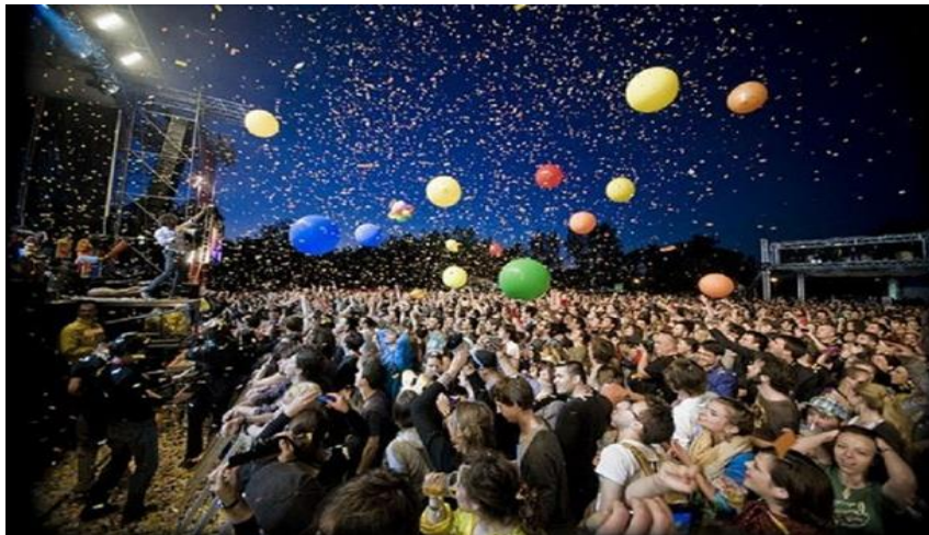
Slika 5. INmusic festival u Zagrebu