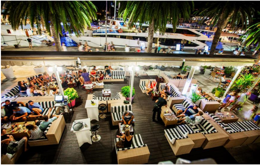
Slika 12. BB club u gradu Hvaru