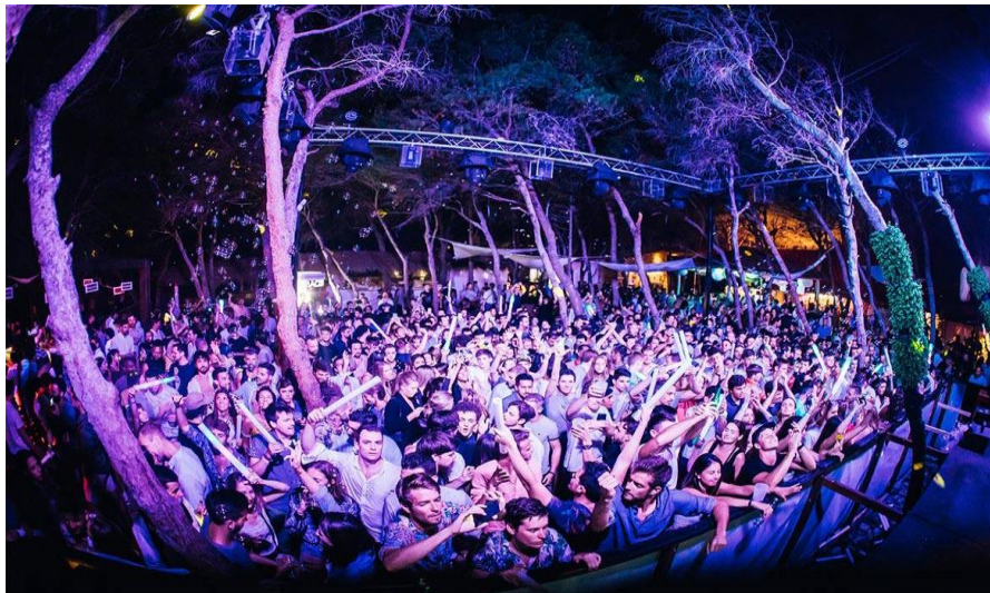
Slika 14. Carpe Diem Beach club na otoku Marinkovcu