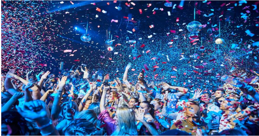
Slika 1. Party na Ibizi