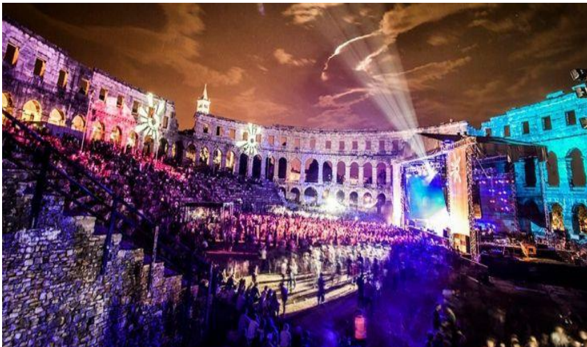
Slika 4. Outlook festival u Puli