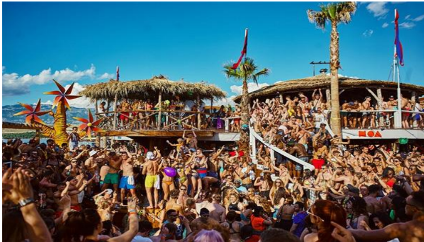
Slika 3. Plaža Zrće na otoku Pagu