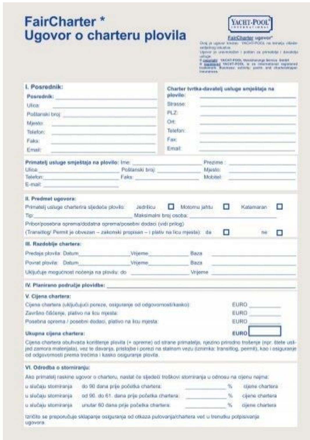
Slika 5. Ugovor o charteru