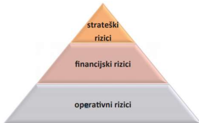
Slika 2 Piramida upravljanja rizicima