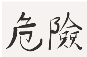
Slika 1 Opasnost i prilika