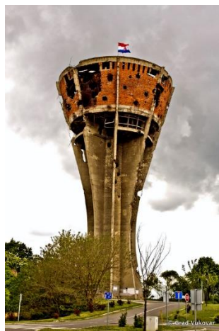
Slika 2: Vukovarski vodotoranj