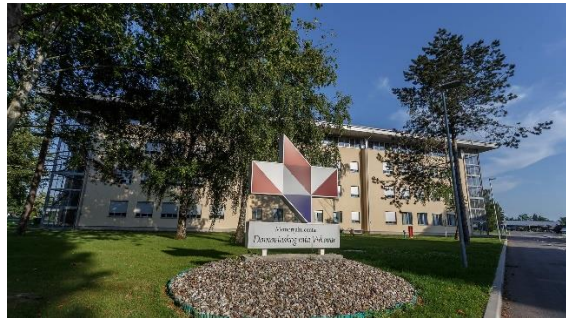
Slika 4: Memorijalni centar Domovinskog rata