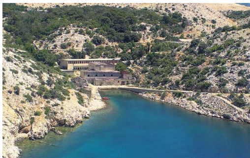
Slika 7: Goli otok