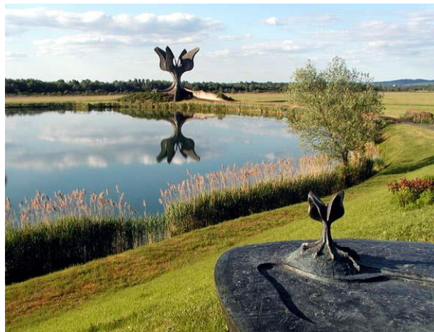
Slika 13: Spomenik Cvijet u Jasenovcu, Bogdan Bogdanović, 1966.