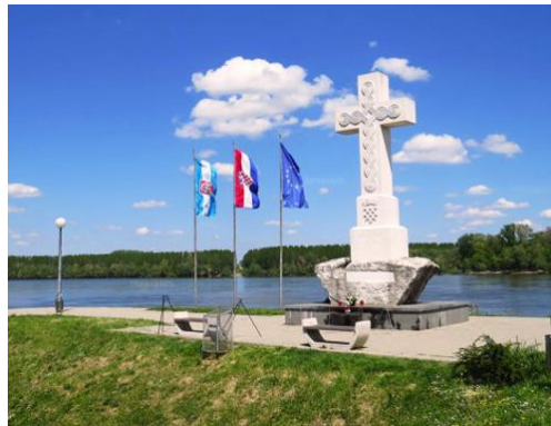
Slika 6: Križ na ušću Vuke u Dunav