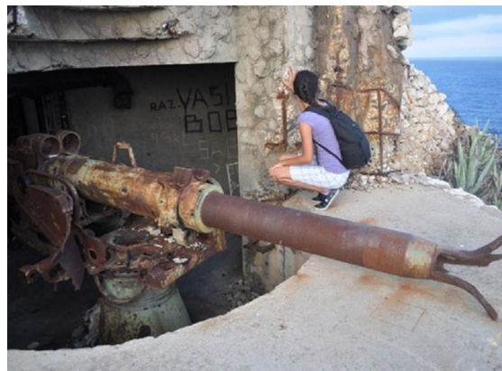
Slika 8: Vis- vojarna