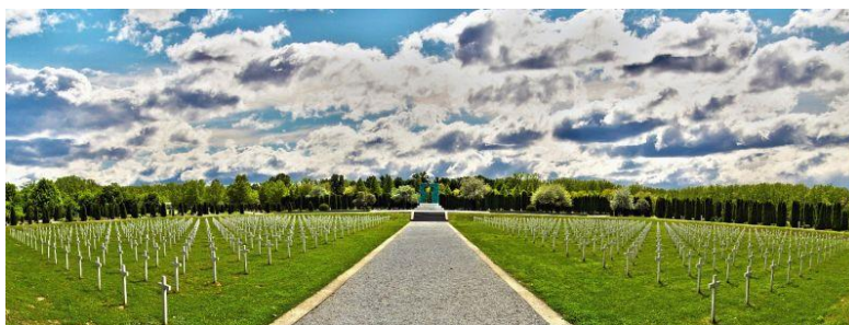
Slika 3: Memorijalno groblje žrtava iz Domovinskog rata