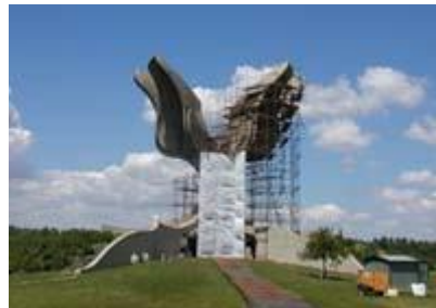
Slika 12: Obnova spomenika