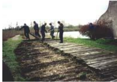
Slika 11: Obnova pasarele