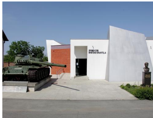
Slika 5: Spomen dom hrvatskih branitelja u Borovu naselju