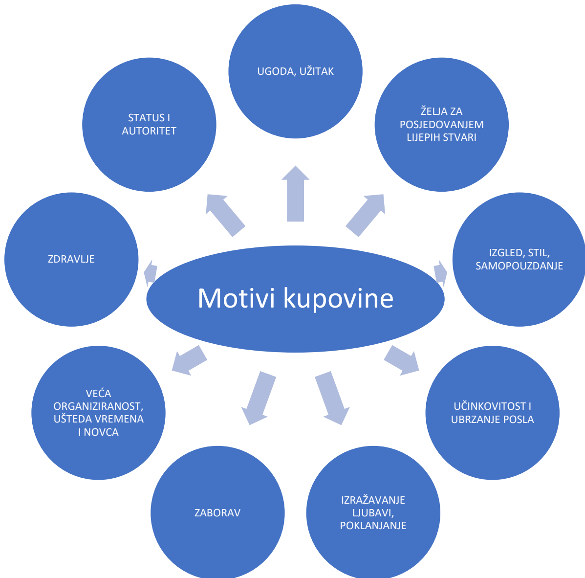
Slika 3. Motivi kupovine.

Izvor: Shema autora izrađena na temelju popisa motiva u Aleksić Anđelić (2015: 555).