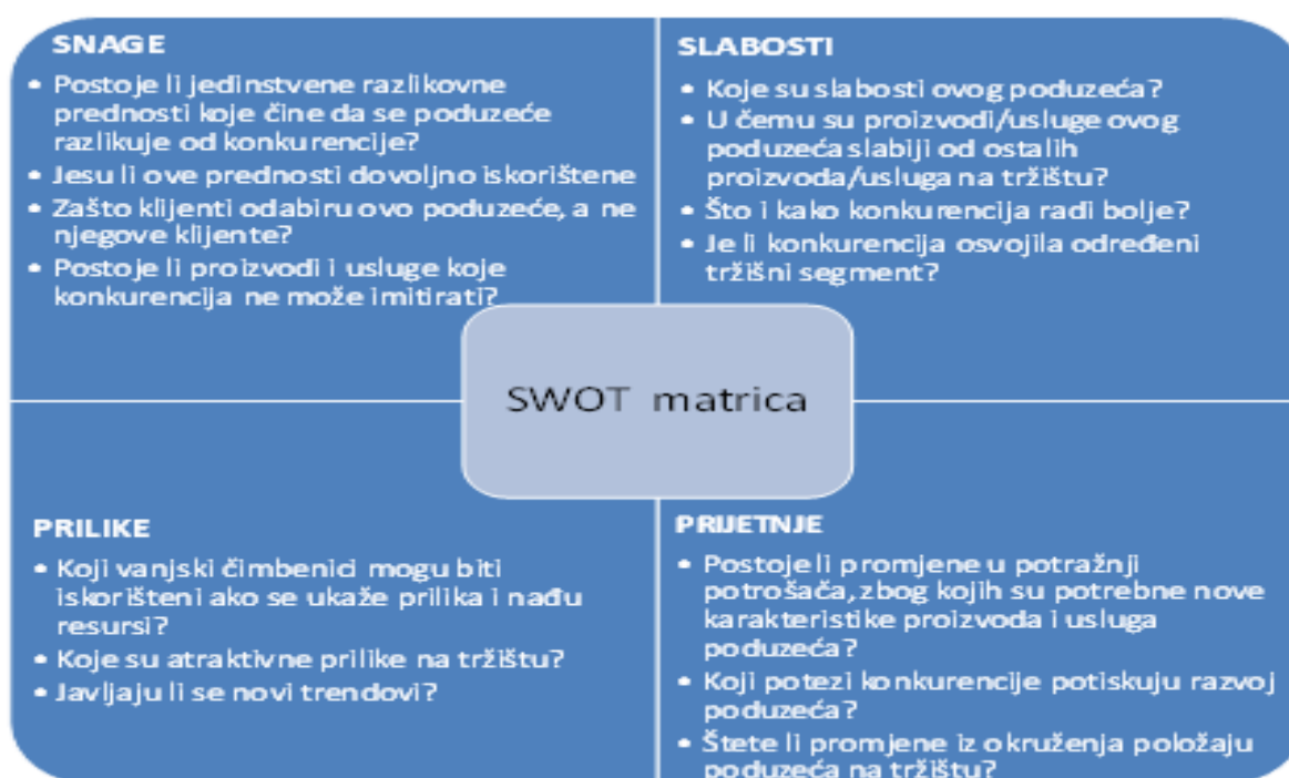
Slika 2: SWOT matrica