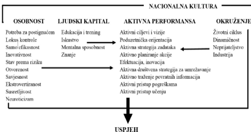
Slika 2. Čimbenici o kojima ovisi uspješnost poduzeća prema karakteristikama poduzeća