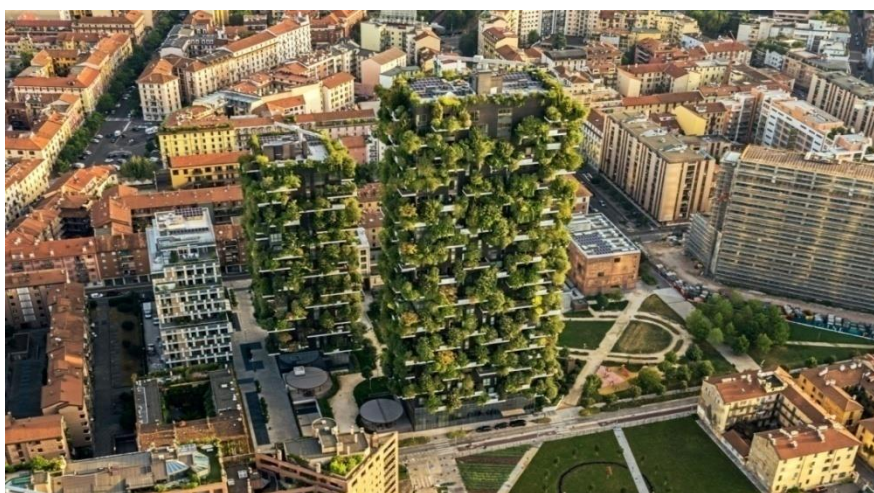
Slika 4. Bosco Verticale u Milanu