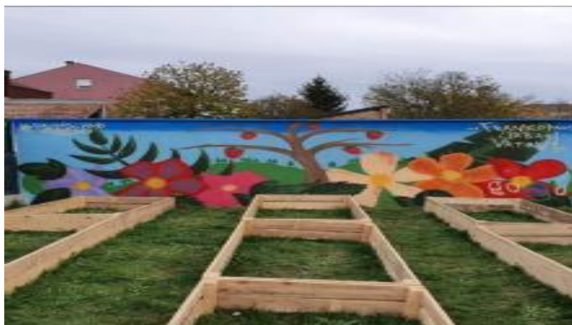
Slika 12. Urbani vrtovi OŠ Frana Krste Frankopana u Osijeku