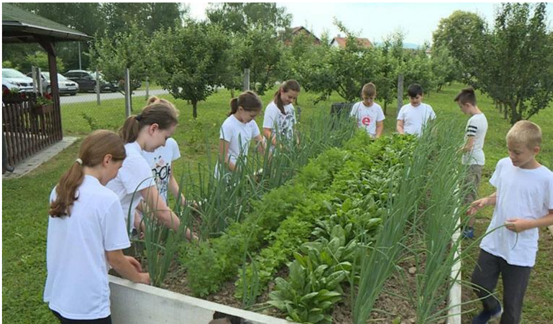
Slika 2. Osnovna škola Lipik ( Najljepši školski vrt u 2018. godini)