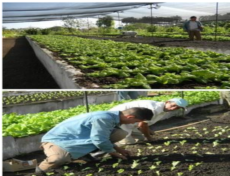
Slika 3. Organski vrtovi u Cienfuegosu na Kubi