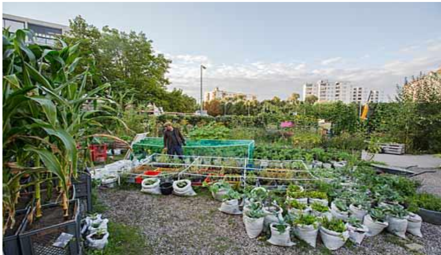
Slika 6. Projekt Prinzessinnengärten, Berlin