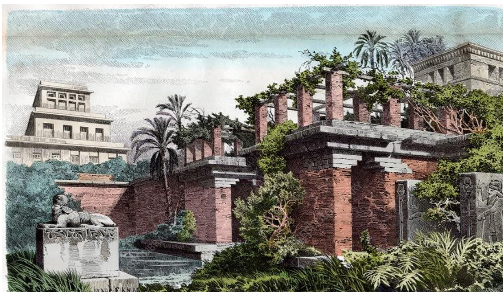
Slika 1. Ilustracija visećih babilonskih vrtova