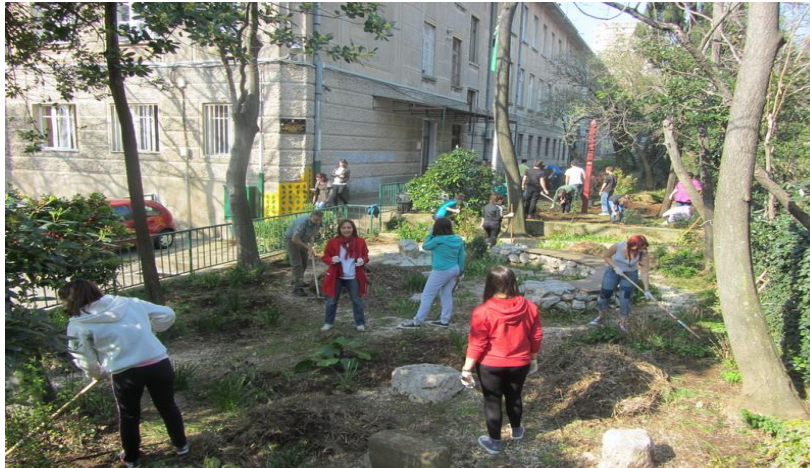
Slika 10. Vrt učeničkog doma 'Podmurvice' Rijeka