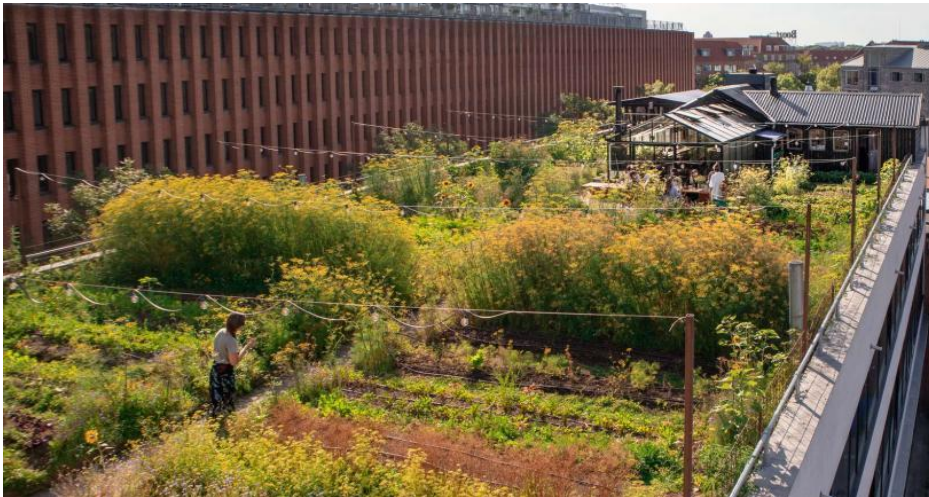
Slika 5. ØsterGro - poznata krovna farma u Kopenhagenu