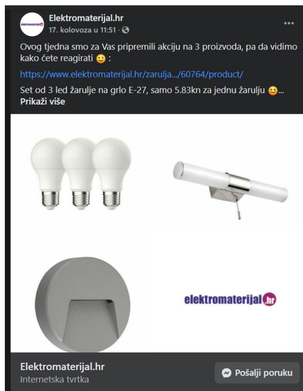
Slika 8. Facebook post