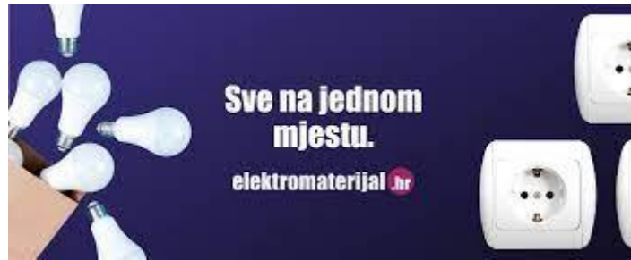
Slika 7. Oglas