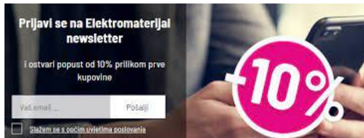
Slika 6. Newsletter

Elektromaterijal.hr periodički šalje newslettere na koje se može prijaviti svatko, čak i ako nema loyalty karticu. Na taj način poduzeće šalje obavijesti, ponude i ostaje u sjećanju korisnika kada žele kupiti neki elektromaterijal.