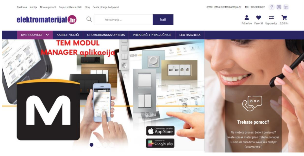
Slika 4. Elektromaterijal.hr Web Shop

Dostavu proizvoda do kupca putem web shopa elektromaterijal.hr poduzeće vrši putem zaposlenika (ako je moguće u okviru Splita) ili dostavnom (kurirskom) službom.