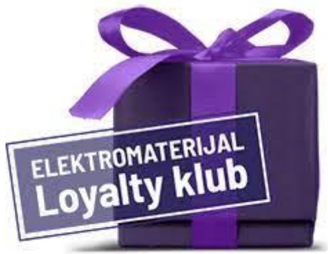
Slika 5. Loyalty klub

Članovima loyalty kluba dostupni su popusti, ponude i novosti koji ostalim kupcima nisu dostupni. Korisnici koji se prijave u loyalty klub dobivaju loyalty karticu, a putem nje poduzeće može pratiti kupovne navike svojih kupaca. Od svojih podataka, korisnici ostavljaju ime, prezime, email adresu i datum rođenja.