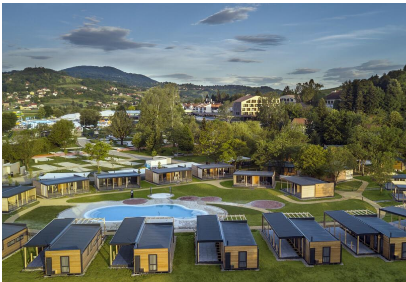
Slika 2. Glamping selo Terme Tuhelj