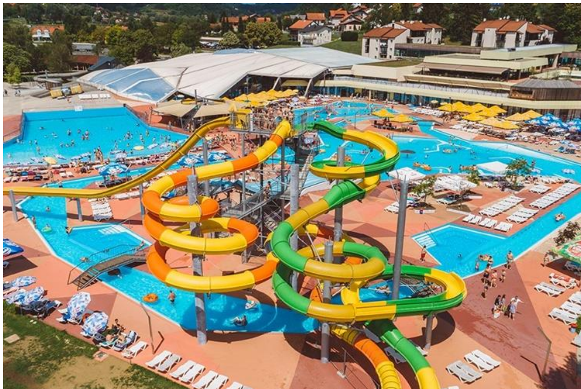
Slika 1. Vodeni Planet Terme Tuhelj

Vodeni planet površine preko 15 000 m 2 sadrži 5000 m 2 vodene površine raspoređene na vanjsko i unutarnje kupalište. Vodeni planet sadrži 4 bazena na unutarnjem kupalištu – dječji bazen s vodenim gradom, plivački bazen namijenjen rekreativnom plivanju, terapijski bazen te wellness bazen s brojnim vodenim masažama, gezirima i slapovima. Vanjsko kupalište sadrži 4 bazena – bazen s valovima, bazen za najmlađu djecu s vodenim životinjama, bazen s Tuhi Landom te veliki rekreacijski bazen povezan vodenom rijekom te koktel barom u vodi.