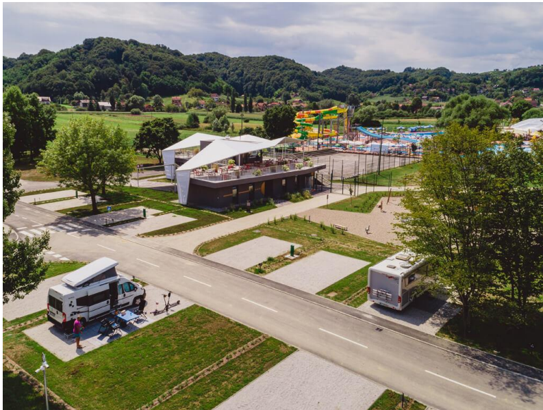
Slika 3. Kamp Vita