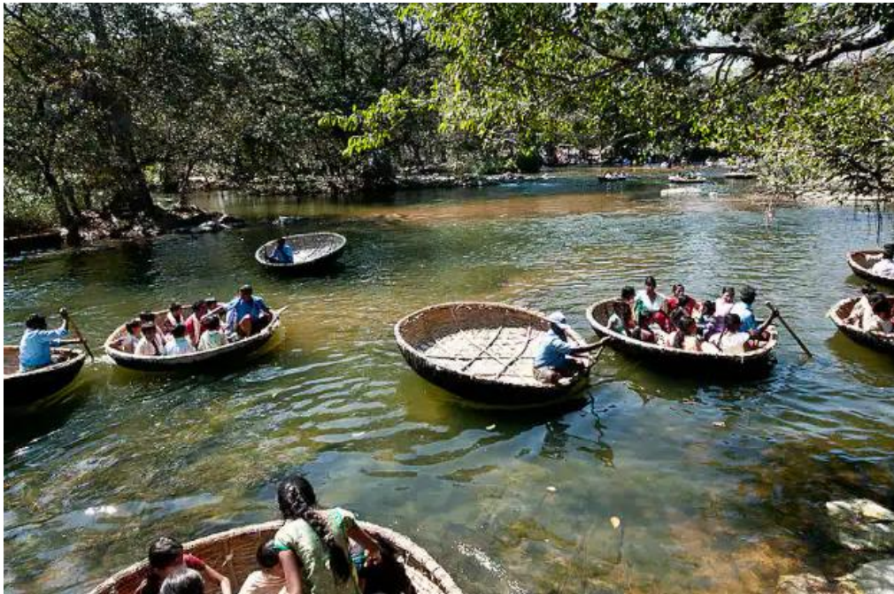
Slika 4: Coracle