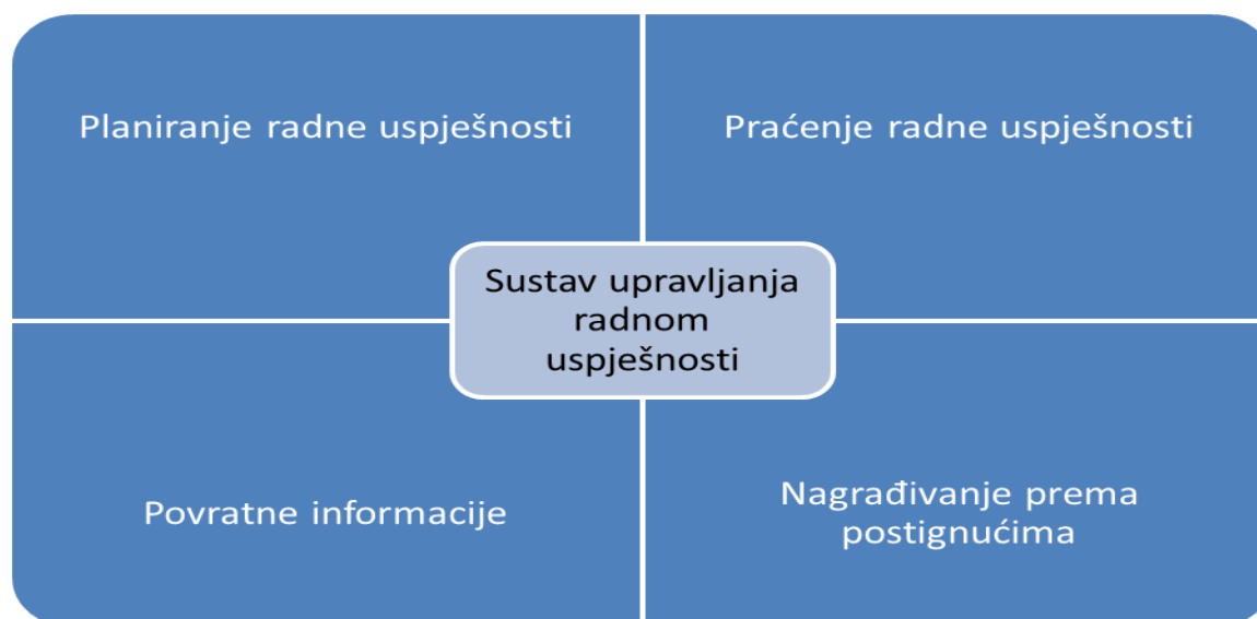
Grafikon 2. Ključne dimenzije sustava upravljanja radnom uspješnošću