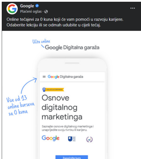
Slika 3. Prikaz Facebook oglasa