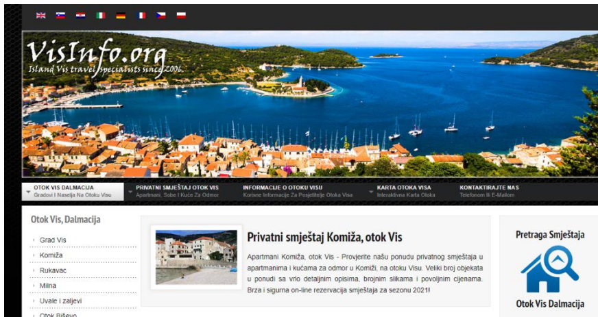
Slika 6. Službena stranica grada Visa