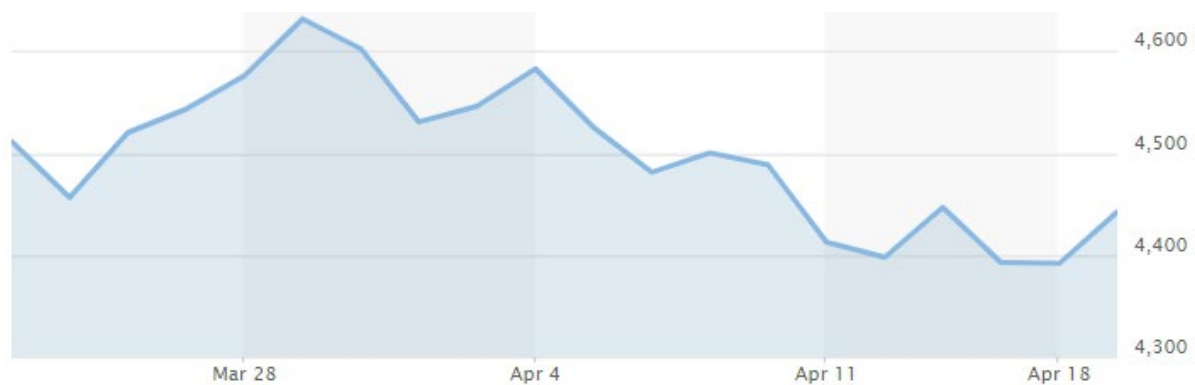
Slika 3. Mjesečna volatilitnost burzovnog indeksa S&P 500