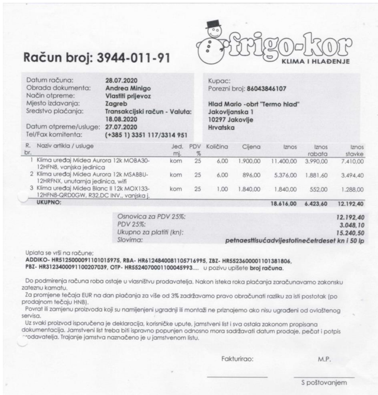
Slika 14. Ulazni račun