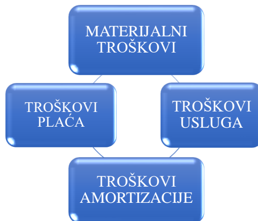
Shema 2. Klasifikacija troškova prema prirodnim vrstama