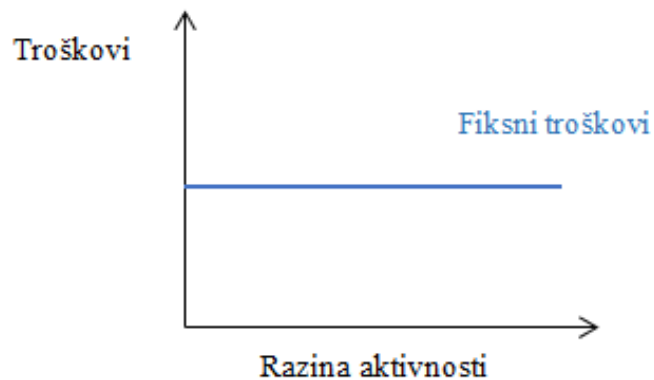
Graf 1. Kretanje fiksnih troškova