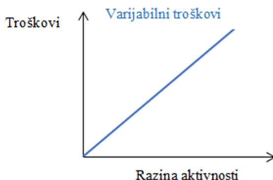
Graf 2. Kretanje varijabilnih troškova