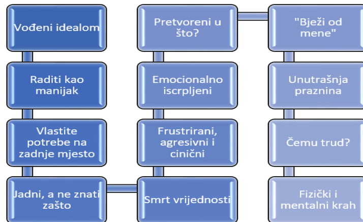
Slika 1. Kretanje kroz faze sindroma sagorijevanja