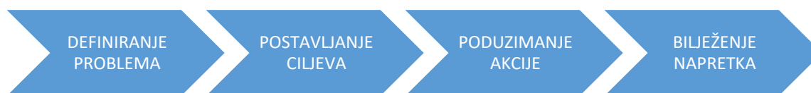
Slika 3. Četiri ključna koraka kod upravljanja sindromom sagorijevanja