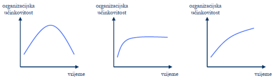
Slika 2. Tendencije u razvoju organizacije