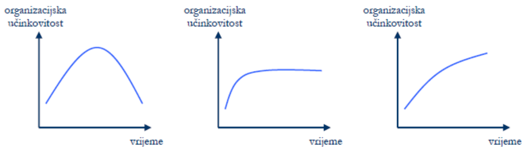
Slika 2. Tendencije u razvoju organizacije

Izvor: Hernaus, T. (2009.), Temelji organizacijskog dizajna. EFZG working paper series, 8, str. 15.