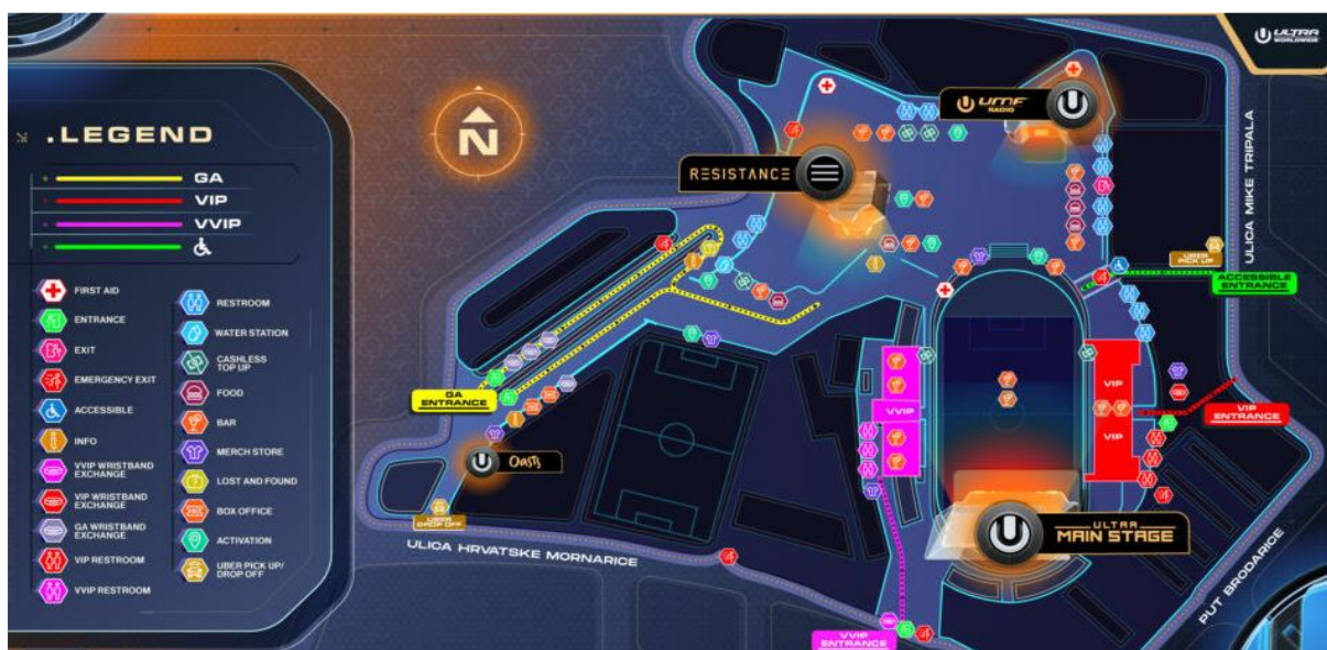
Slika 3. Mapa događaja Ultra festivala.