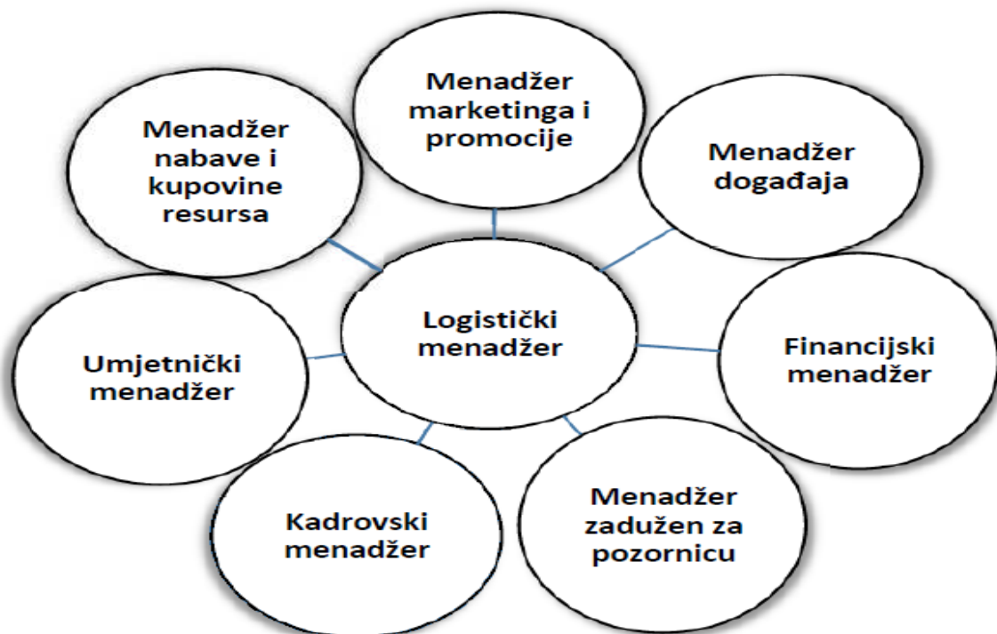
Slika 1. Logistički menadžment događaja

Izvor: Mrnjavac, E. (2010.), Logistički menadžment u turizmu, Opatija: Fakultet za menadžment u turizmu i ugostiteljstvu, str. 41.